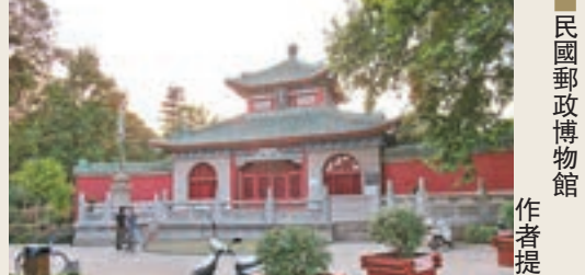
民國郵政博物館