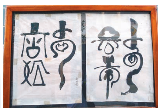
■水壩小學內的水族文字，右邊為「愛祖國」，左邊為「愛父母」。