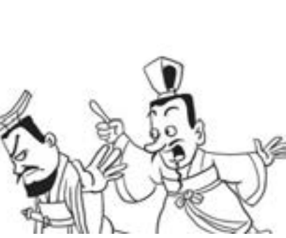
4. 但劉濞沒採納枚乘的忠告，一意孤行，起兵反叛，最終被朝廷鎮壓。