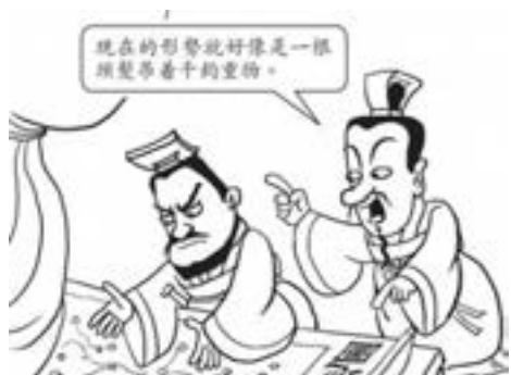
1. 西漢時期，吳王劉濞想要反叛朝廷，他的謀臣枚乘就去勸阻他。

鈞：古代重量單位，一鈞約合當時三十斤。千鈞重的東西繫在一根毛髮上。比喻情況萬分危急。也作「一髮千鈞」。