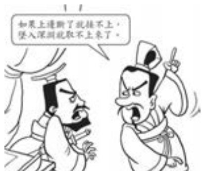
2. 枚乘說，這千鈞重物上面懸在沒有盡頭的高處，下邊是無底的深淵。