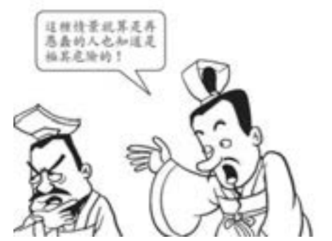
3. 枚乘說，這種情景就是再愚蠢的人也知道是極其危險的。