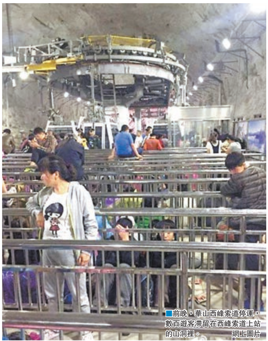
前晚，華山西峰索道停運，數百遊客滯留在西峰索道上站的山洞裡。

假期首四天，國家旅遊局組織三個市場秩序檢查組分赴湖南、雲南、山東三省開展旅遊市場秩序檢查工作，確保國慶假期旅遊秩序平穩、有序、安全。