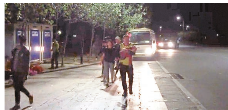
滯留遊客摸黑徒步下山。