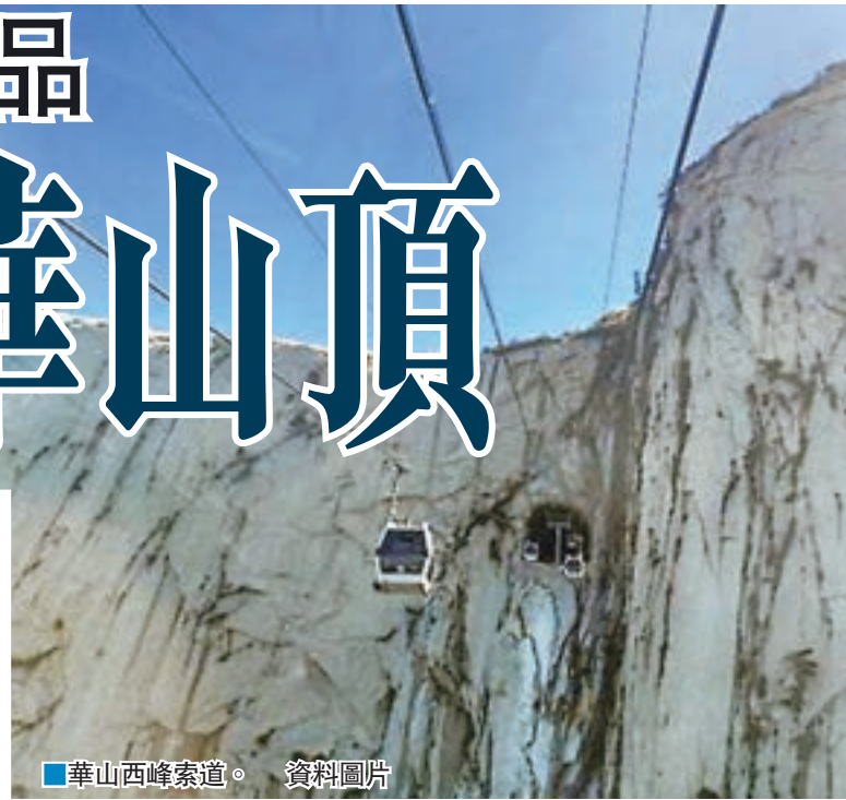
華山西峰索道。