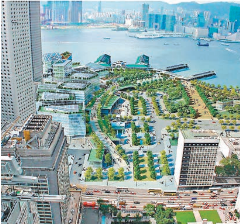
中環新海濱三號地效果圖