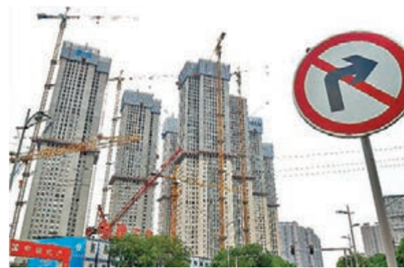
近日多個城市推出限購令,市場擔心政府調控措施加重,昨日內房股走勢偏軟。