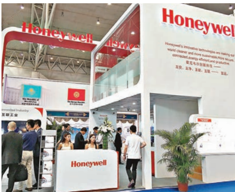
霍尼韋爾攜眾多基礎設施建設領域產品亮相亞歐博覽會。

據了解，根據協議，霍尼韋爾擬在烏魯木齊設立中亞智能電網基地，聯合烏魯木齊政府推進智能電網建設，並會同第三方合作開展電網改造及配電生產。此外，雙方還將積極合作支持烏魯木齊國際機場建設，拓展多元化航空業務，推動通用航空發展和支線航空開發，攜手助力烏魯木齊建設中亞地區的國際化門戶城市航空樞紐。