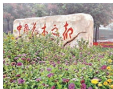
中原花木交易博覽會日前在河南省鄆陵縣舉行。

香港文匯報訊(記者 馮雷 鄭州報導)為期四天的第十六屆中國·中原花木交易博覽會近日在河南省鄆陵縣舉行，此間共簽約項目29個、總投資196.4億元人民幣(下同)。今屆中原花博會包含花事、招商、文化、旅遊四大特色活動，使得本屆花博會特色獨具，異彩紛呈。在項目簽約暨頒獎儀式上，本屆花博會共簽約項目29個，總投資196.4億元，其中15億元以上項目5個，其中有投資15億元的養老旅遊產業園項目、投資15.4億元的電梯隨行電纜項目、投資20億元的「城中村」改造項目等投資金額較大的項目。包括7家世界500強、全國500強企業、15