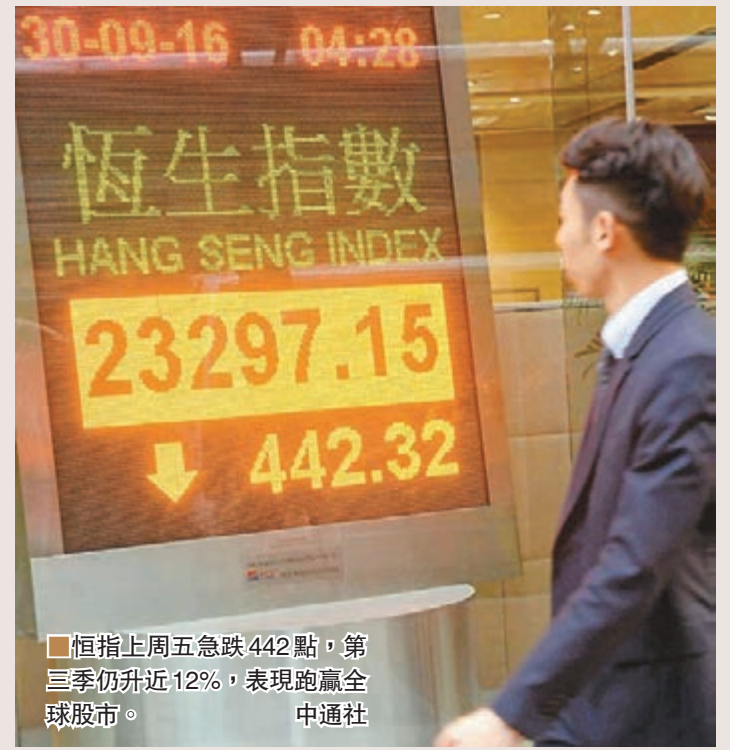
恒指上周五急跌442點,第3季仍升近12%,表現跑贏全球股市。