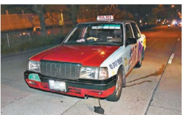
被的士輾過青年當場斃命,警員用帳篷遮蓋其屍體調查。

肇事的士則停在相距死者伏屍位置約30米外,不過,警方初步調查發現的士並無撞凹損毀的痕跡,但車頭左邊沙板及泵把位置沾有肉碎及頭髮。