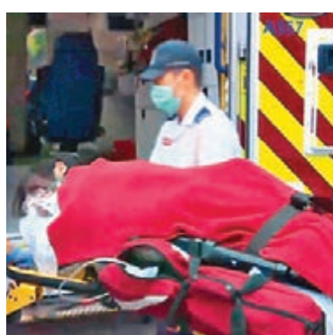
腰部及腳部共中3槍的疑犯,送院搶救後情況危殆。