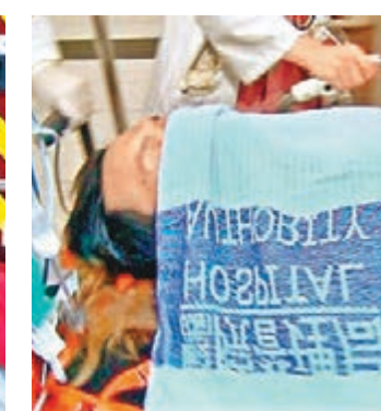
左臂中槍的23歲疑犯送院。