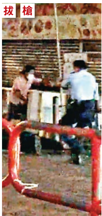
警員擊槍喝止(左圖),但其中一名疑犯仍繼續斬人(右圖),警員終開槍制止。

警察員佐級協會發言人董耀明表示,昨日警員開槍符合警例。他解釋,警員使用槍械須按現場環境變化作判斷,一般開槍訓練指引是要求射向對方身體的「最大部分」,以及容許警員在遇襲時,可使用較兇徒手持的再高一級別武器制止。一般而言,開槍警員稍後都會獲安排與警隊職員及訓練主任會面,然後一周內再由警隊臨床心理學家評估其開槍後的精神狀況。