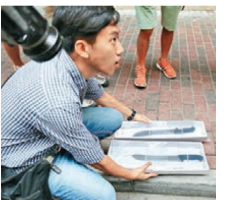
探員檢走涉案兩柄牛肉刀。