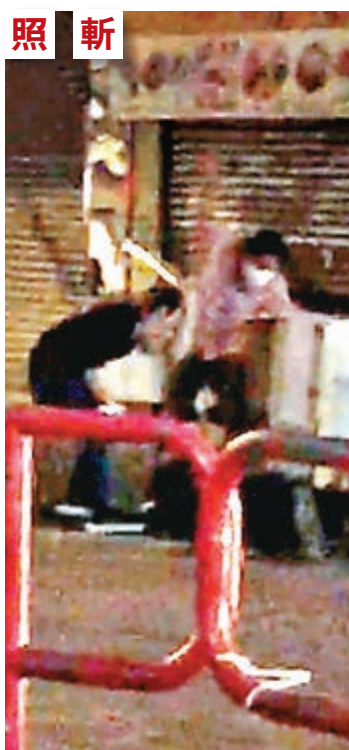
兩名開槍警員及擒獲欲逃疑人的便衣女警(左一)事後在現場協助。