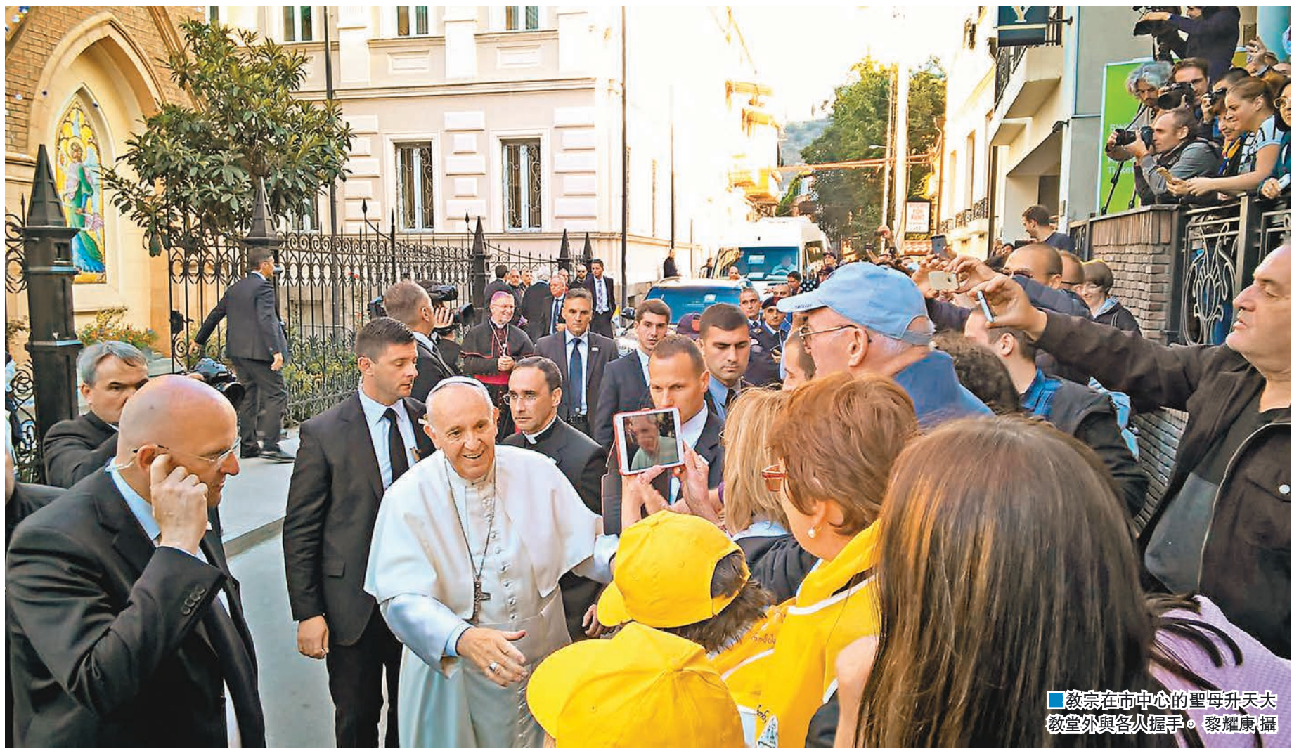
教宗在市中心的聖母升天大教堂外與各人握手。