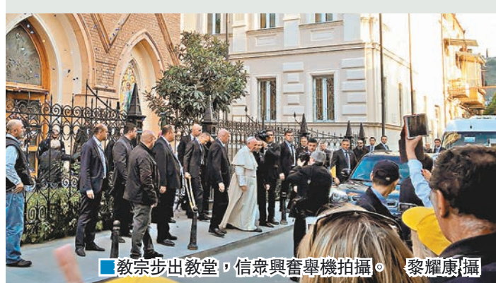
教宗步出教堂，信眾興奮舉機拍攝。