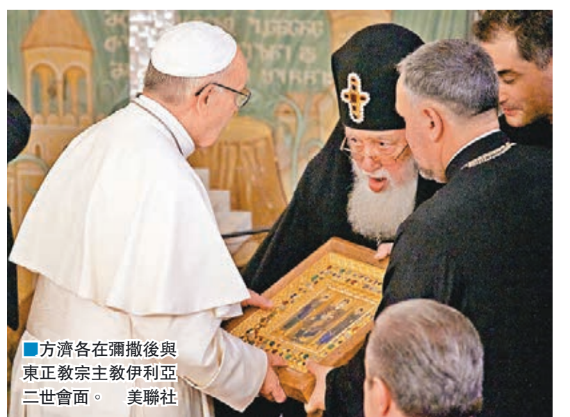
方濟各在彌撒後與東正教宗主教伊利亞二世會面。