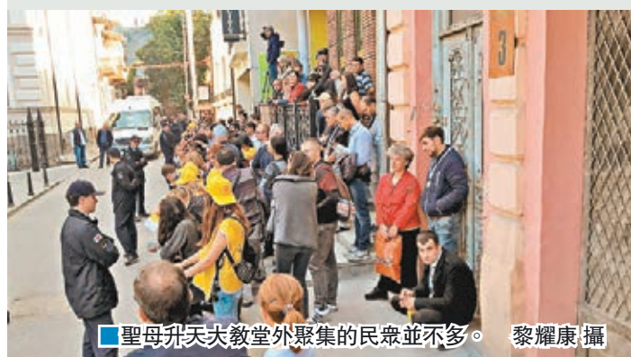
聖母升天大教堂外聚集的民眾並不多。