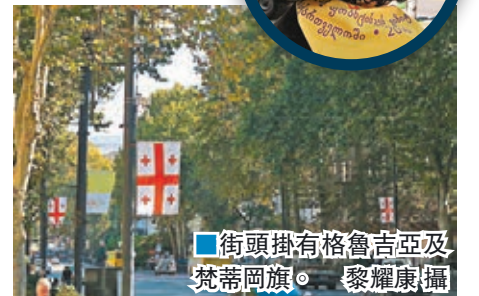
街頭掛有格魯吉亞及梵蒂岡旗。