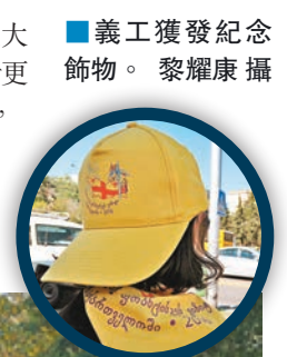
義工獲發紀念飾物。

方濟各2013年成為教宗後，積極向東正教伸出橄欖枝，希望達成最終和解。冷戰後，格魯吉亞脫離蘇聯，83歲的伊利亞二世帶領當地東正教會復興。相比俄羅斯等其他東正教會而言，格魯吉亞的教會更加保守，伊利亞二世曾形容同性戀是「疾病」，應以戒毒般的手段治療同性戀者。