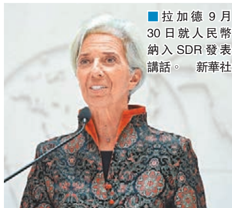
■拉加德9月30日就人民幣納入SDR發表講話。

國際貨幣基金組織(IMF)總裁拉加德前日在華盛頓宣佈，IMF將從今年10月1日起正式啓用包括人民幣在內的新的特別提款權(SDR)貨幣籃子。她說，這是一個重要的