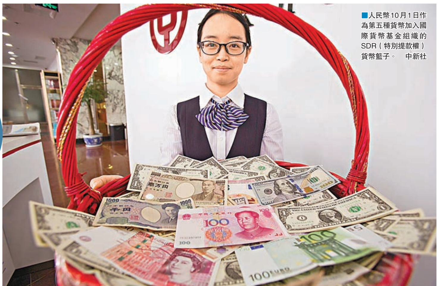
■人民幣10月1日作為第五種貨幣加入國際貨幣基金組織的SDR(特別提款權)貨幣籃子。 中新社