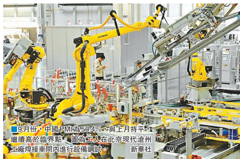
■9月份，中國PMI為50.4%，與上月持平，繼續高於臨界點。圖為工人在北京現代滄州工廠焊接車間內進行設備調試。

上月上升0.2個百分點，連續兩個月上升，創下了今年以來的最高值，也高於去年同期水平。