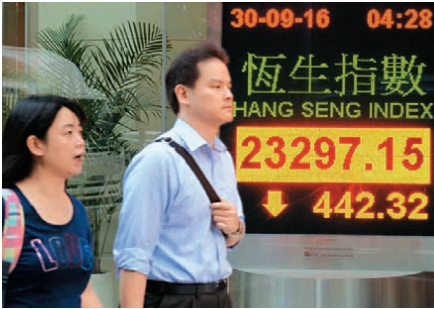
恒指昨跌442點,收報23,297點,但計及整個第三季,仍升近12%,表現跑贏全球股市,也是2009年以來表現最好的第三季。中新社

瑞信亦發表報告,指踏入10月傳統淡季,估計10月尾或11月初會出現大規模獲利回吐,屆時才宜低吸,維持恒指12個月目標24,000點。匯豐私人銀行亦指,第四季風險因素密集,投資策略應轉為防守,投資者宜減持股票。