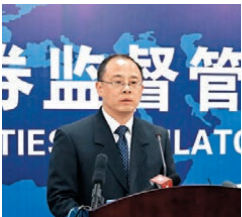
中證監新聞發言人鄧舸。

香港文匯報訊(記者 海巖 北京報道)中國證監會昨日發佈《內地與香港股票市場交易互聯互通機制若干規定》並即日起施行。中證監新聞發言人鄧舸表示,規定明確了滬