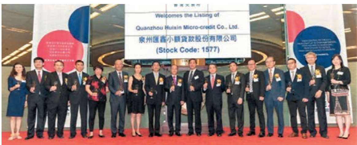
泉州匯鑫小額貸款昨於港交所主板上市,圖為上市儀式。

香港文匯報訊(記者 陳楚倩)雖然港股近期表現反覆,但新股市場仍保持興旺。興證國際(8407)、鄭文記(8023)、東盈(2113)、創建(1609)昨日均開始首日招股,當中東盈及創建孖展認購已超購,興證及鄭文記孖展認購則未足額。市場消息指,興證國際配售已足額認購。