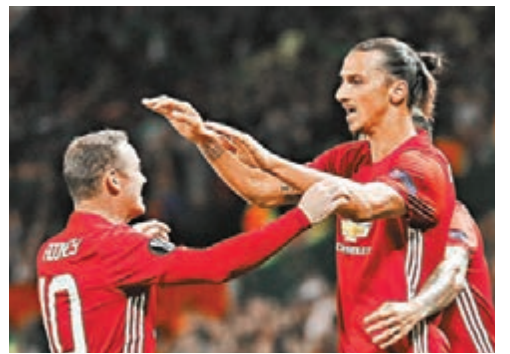
伊巴謙莫域(右)跟朗尼慶祝入波。