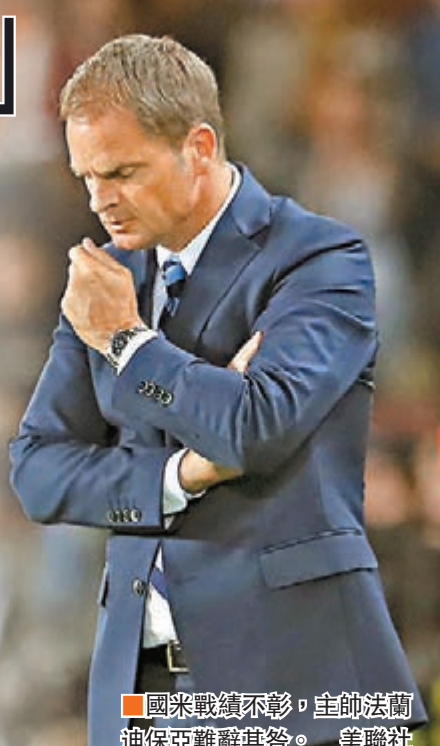
國米戰績不彰, 主帥法蘭迪亞亞難辭其咎。