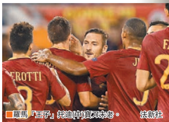
羅馬「王子」托迪(中)賣力未老。