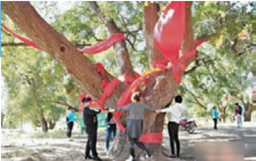
■「老樹王」樹齡近千年。