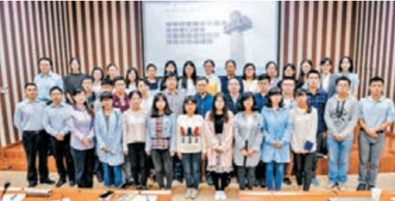
■南京大屠殺倖存者口述史調查項目工作人員合影。

南京大屠殺倖存者既是侵華日軍南京大屠殺歷史的受害者，也是南京大屠殺歷史有力的見證人。近年來由於年事已高，很多倖存者相繼離開了人世。為了搶救性採訪南京大屠殺倖存者口述史，侵華日軍南京大屠殺遇難同胞紀念館昨日聯合南京大學，於即日起對目前健在的、對南京大屠殺有清晰記憶且身體狀況良好的50位倖存者，進行口述史調查與採訪。