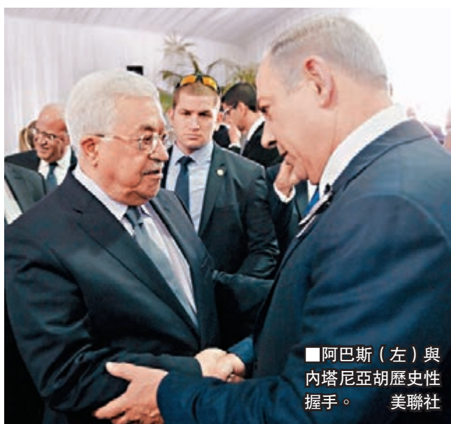
阿巴斯(左)與內塔尼亞胡歷史性握手。

以色列昨日在耶路撒冷的赫爾茨山國家公墓，為日前因中風逝世的前總統佩雷斯舉行盛大國葬，佩雷斯的家屬、來自超過70個國家的政要及大批以國民眾共6,000人出席，一起送別這位畢生推動以巴和平的領袖，儀式結束後，佩雷斯的遺體安葬於1995年遇刺的前總理拉賓墓地旁。