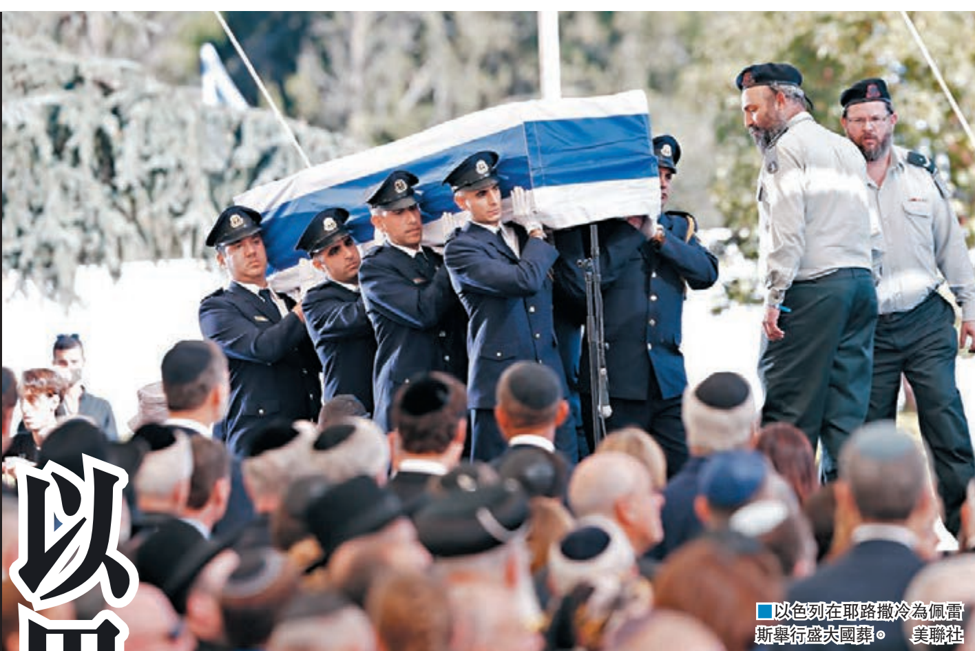
以色列在耶路撒冷為佩雷斯舉行盛大國葬。