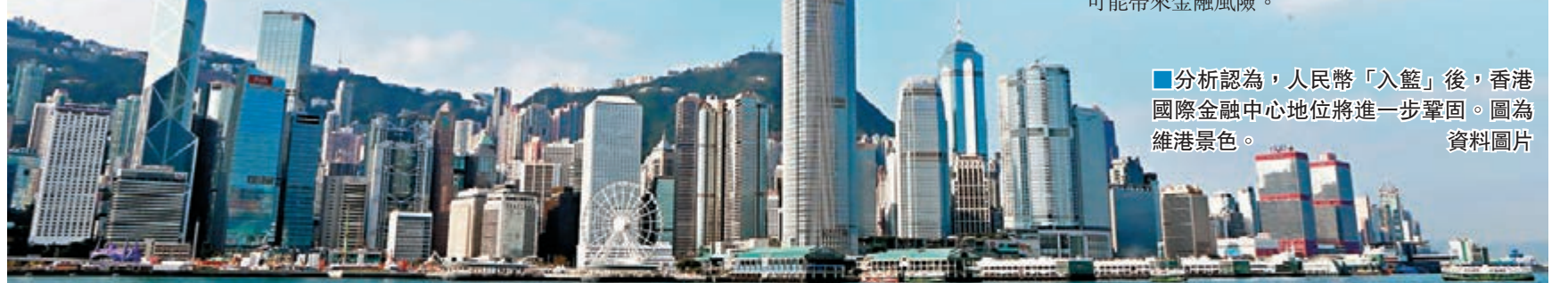
■分析認為,人民幣「入籃」後,香港國際金融中心地位將進一步鞏固。圖為維港景色。資料圖片

巴尤米認為,隨着人民幣國際化發展和中國在全球經濟中影響力上升,人民幣在全球外匯儲備資產中的比重也將上升,但人民幣要想成為主要國際儲備貨幣,還需要中國進一步推動經濟和金融改革,增強匯率靈活性,放鬆金融市場管制和開放資本賬戶。不過他也提醒,中國要注意把握好金融改革次序和開放節奏,過快開放資本賬戶可能帶來金融風險。