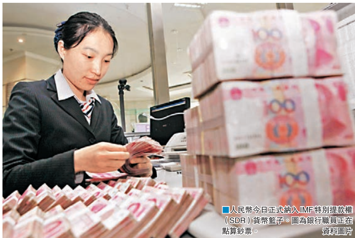
人民幣今日正式納入IMF特別提款權(SDR)貨幣籃子。圖為銀行職員正在點算鈔票。資料圖片

同時,中國央行還將按照加強供給側結構性改革的要求,繼續深化金融體制改革,增強金融運行效率和服務實體經濟能力,加強和完善風險管理。進一步推進利率市場化和人民幣匯率形成機制改革,保持人民幣匯率在合理均衡水平上的基本穩定。