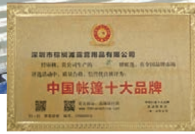
深圳市棕櫚灘露營用品有限公司出品「榮獲中國帳篷十大品牌」殊榮。