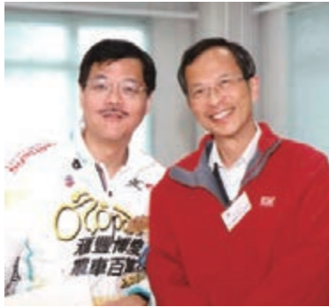
時任立法會主席曾鈺成出席博愛醫院活動與李柏成博士合照