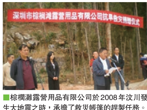
棕櫚灘露營用品有限公司於2008年汶川發生大地震之時，承擔了救災帳篷的趕製任務。