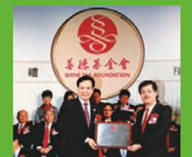
獲善德基金會委任要職