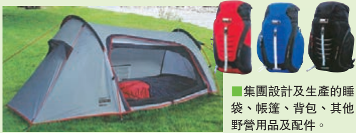
集團設計及生產的睡袋、帳篷、背包、其他野營用品及配件。