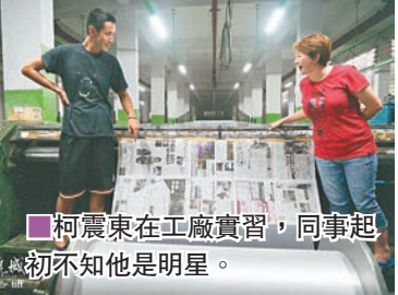
柯震東在工廠實習,同事起初不知他是明星。

台灣演員柯震東早前拍攝新片《再見瓦城》時,被導演趙德胤送去泰國工廠打工實習,來自柬埔寨、寮國等地的同事真的當他是「新來的同事」,不知道他是電影演員。由於工廠時常需要黏貼舊報紙在機器上方方便工作,有一天報紙上竟然出現柯震東的新聞,於是他興奮指着報紙跟同事炫耀,沒想到對方多次比對仍不相信,還覺得報紙裡的人比較帥,後來剪下報紙比對才勉強相信,柯震東開心說:「需要觀察10分鐘才覺得像,表示辛苦一個月有用。」而導演則叮囑老闆:「他們跟工人一樣按時上下班,如果打混摸魚,請像其他工人一樣罵他。」,柯震東形容:「簡直像是進監獄」。