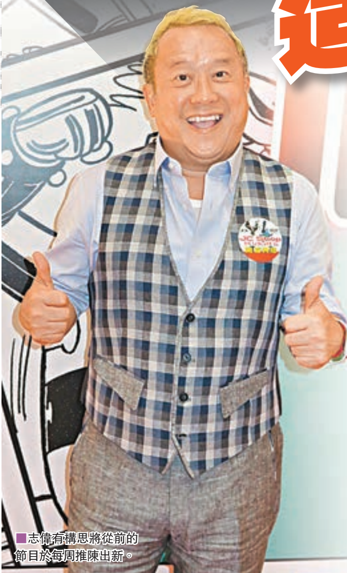
志偉有構思將從前的節目於每周推陳出新。