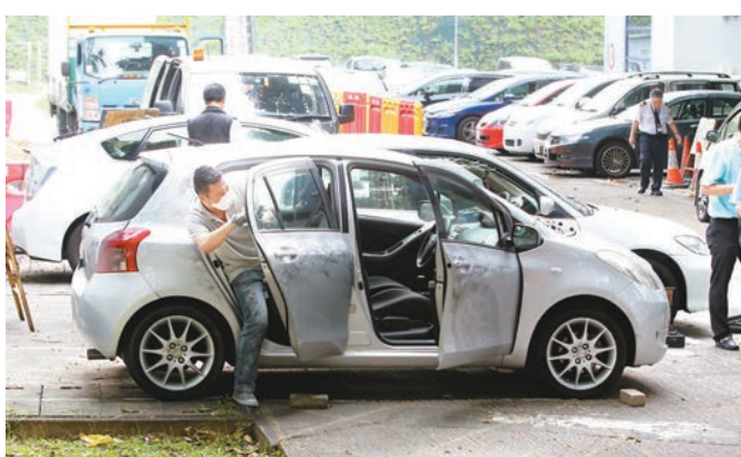
■鑑證人員在爆竊疑犯的私家車蒐證。

警方西九龍重案組早前接獲線報，指有竊賊將會犯案，調查後鎖定3名目標男子並進行跟蹤。至昨日凌晨3時許，探員發現3名疑人駕乘一輛私家車抵達紅磡差館里。