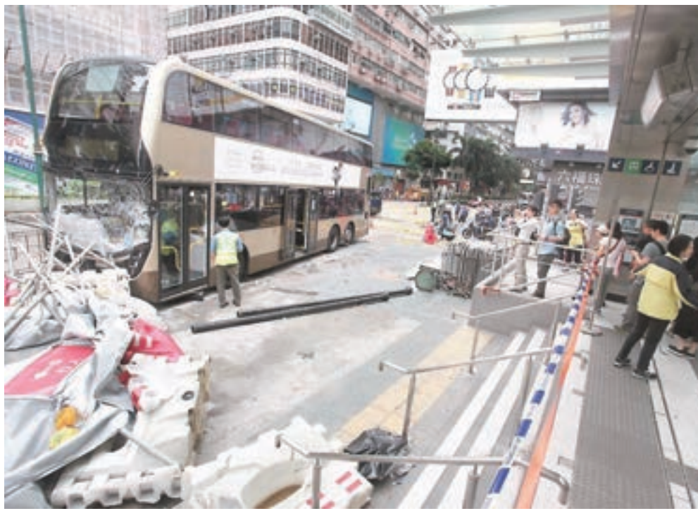
■肇事九巴在彌敦道近海防道剷上行人路撞斃女途人，並掃毀一列水馬。

消息稱，肇事九巴去年始出廠，今年1月才首次登記「落地」投入服務，屬新款雙層巴士。九巴工會稱，該款巴士全車共裝有9個「天眼」(閉路電視鏡頭)，分別設於車頭、車尾、車廂樓梯位、駕駛座等，相信能拍攝到事發經過及司機出事時的狀況，有助警方調查意外原因。