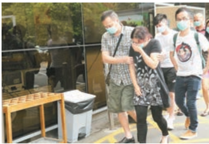
■女死者多名親友事後趕到醫院了解，各人得悉噩耗後均傷心痛哭。