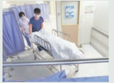
■韓籍男子踩單車在愉景灣被撞死，遺體昇送殮房。

香港文匯報訊(記者 杜法祖)愉景灣高爾夫球會一輛穿梭巴士，昨日中午駛經愉景山道斜路時，撞倒一名正踩單車落斜的40歲韓國籍男子，韓漢當場仰車翻重傷昏迷，送院不治。警方正調查肇因。有離島區議員指，愉景灣不少居民都踩單車代步，提醒踩單車居民應注意安全。