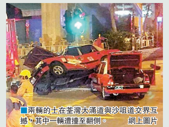
■兩輛的士在荃灣大涌道與沙咀道交界互撼，其中一輛遭撞至翻側。

香港文匯報訊(記者 杜法祖)警方昨日午夜在荃灣調查一宗的士相撞交通意外期間，發覺另一輛途經的士司機在駕車途中使用手機，但示意其停車受查時，對方竟加油欲逃，警員窮追約2公里終將對方截停，再揭發有人在停牌期間繼續駕的士營業，將其拘捕扣查。