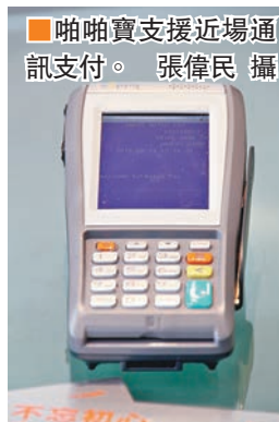
啲啲寶支援近場通訊支付。張偉民 攝