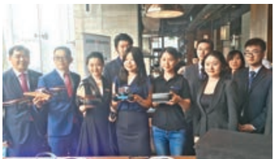
與會嘉賓和參展商在現場展示產品。

香港文匯報訊 (記者 周曉菁)「環球資源2016秋季系列展」昨日舉行展前媒體會，環球資源電子組總裁黃澤偉在會上表示，無人機、虛擬實境、可穿戴電子設備、智能家居等4類產品為當下電子行業的趨勢。目前行業競爭十分激烈，企業可以通過生產不同系列的产品，吸引各類消費者。