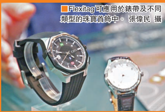
Flexitag可應用於錶帶及不同類型的珠寶首飾中。