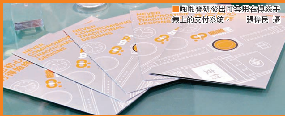
啲啲寶研發出可套用在傳統手錶上的支付系統。