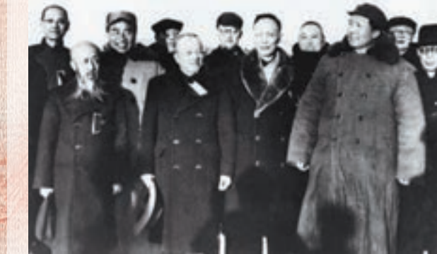
1949年3月25日,毛澤東同民主人士在北平西苑機場合影。 資料圖片

北京作為四個直轄市之一,是全國政治、科學文化的中心,國內國際交往的中心之一,更是中國歷史文化名城和古都之一。而其定都細節卻並非人盡皆知。