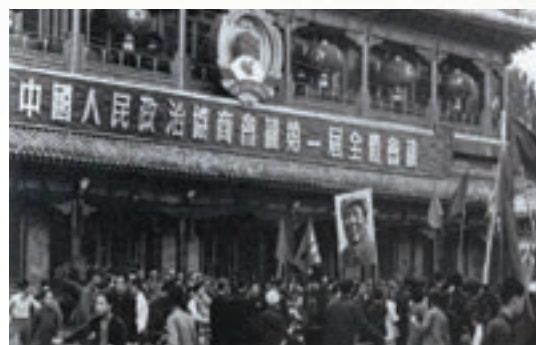
中國人民政治協商會議第一屆全體會議於1949年9月21日至9月30日在北京舉行。