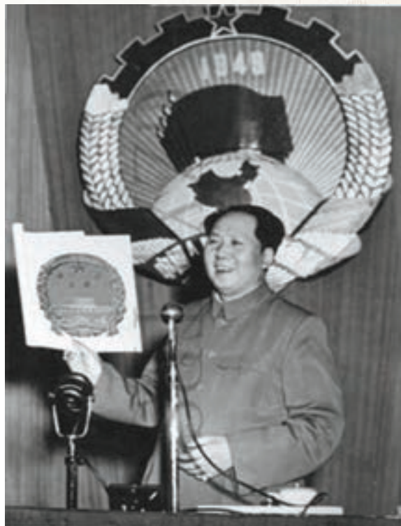
1950年9月20日,中央人民政府主席毛澤東發佈命令,公佈中華人民共和國國徽圖案。 資料圖片