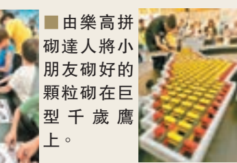
由樂高拼砌達人將小朋友砌好的顆粒砌在巨型千歲鷹上。