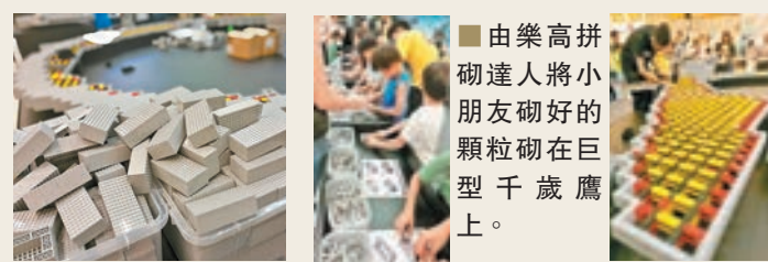
由小朋友協助砌出的顆粒

同時，LEGO 贏得本地土生土長的樂高拼砌藝術家兼星戰迷為今次活動拼砌大型的樂高星球大戰展覽，一連6集《星球大戰》系列電影中的每一集經典場景，將首次全系列上陣，以LEGO顆粒重現大家眼前，其中一個神秘展櫃更會於9月30日正式揭幕，率先呈現星戰最新電影的奧秘。