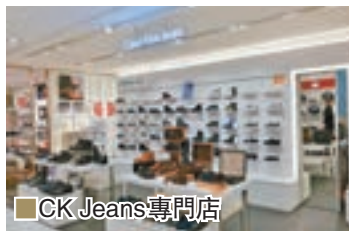
CK Jeans 專門店

鞋履。例如，被列入 Trendy & Fashion 區域的 CK Jeans 的鞋履較為簡單設計，以黑、白、灰為主，讓人更容易配襯任何服飾。