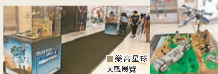
樂高星球大戰展覽