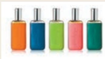
Atelier Cologne 30毫升精醇古龍水及專屬刻字皮製瓶套 (HK$ 950)

香水，從來是點綴任何時尚裝扮不可或缺之物。踏入初秋，ifc商場為你呈獻芬芳馥郁的秋日消費禮遇，讓各種迷人香氣盡情躍動，激發你身上令人怦然心動的嫵媚魅力。由即日起，大家在商場內消費滿指定金額，即可獲贈香水禮品，當中如消費滿HK$5,000或以上，即可獲贈 Atelier Cologne 30毫升精醇古龍水及專屬刻字皮製瓶套乙份。