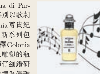
Note di Colonia III

另外，創立100周年的 Acqua di Parma，為慶祝第一個百年誕辰，特別以歌劇世界為靈感，呈獻 Note di Colonia 尊貴紀念作 (HK$3,560/ 150ml)。全新系列包含三款古龍水，裝璜設計重新詮釋 Colonia 的始創版香水瓶，由瓶蓋、精工雕塑的瓶身到高貴的標識，均經由設計師仔細鑽研原裝版本捕捉箇中精髓，重新演繹為優雅的現代版本。通透的水晶瓶蓋呈圓錐形，隱隱呼應品牌歷史悠久的古典瓶子，並且由技藝超凡的工匠大師在意大利以人手製造。