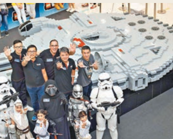
巨型千歲鷹完成品。

繼早前於香港動漫電玩節舉行的 LEGO「香港昔今」大型展覽後，為期3周的「樂高星球大戰：Master Your Force Together」活動亦於海港城登場。由即日起至10月13日，一系列樂高星球大戰的主題活動已於海運大廈地下陸續展開。