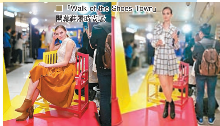
「Walk of the Shoes Town」開幕鞋履時尚騷

這個SHOES TOWN佔地超過13,000平方呎，匯聚過百個不同風格的國際品牌，包括多個首次來港及只限於這兒獨家發售的名牌新品，如 Aldo Brue 及 Premiata，而 CK Jeans Shoe、Ohw?、Kenneth Cole 及 Bruno Magli 等則只有在這兒設立專門店。同時，millie's、Hush Puppies Tassels、fitflop、RegettaCanoe、S.Culture、ecco、Trussardi、INNIU 等鞋店，你都可以一次過在這兒看到。