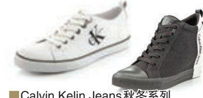
Calvin Kelin Jeans 秋冬系列