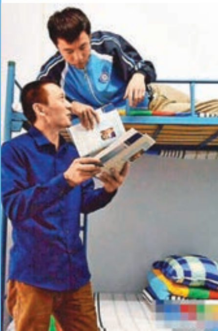
■父子倆同吃、同住、同學習。

今年9月中旬，四川省南充衛生學校第五屆農村醫生班迎來新學期，在2016級農村醫生1班，有一名父親和兒子在一個班級讀書引來很多同學的關注。