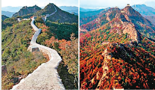
■被抹平的「最美野長城」與原貌對比。

對「為什麼使用水泥」問題，調查組專家說，加水泥後，能盡快牢固早期牆體，但沒有做好實驗工作，對長城觀瞻造成影響。