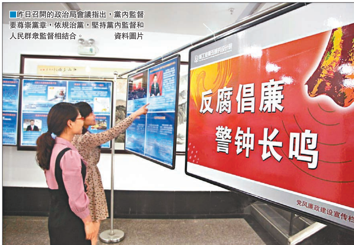
■昨日召開的政治局會議指出，黨內監督要尊崇黨章，依規治黨，堅持黨內監督和人民群眾監督相結合。資料圖片

香港文匯報訊（記者 劉凝哲 綜合報導）中共十八屆六中全會的召開時間和主要議題昨日正式公佈。中共中央政治局會議決定，六中全會將於10月24日至27日在北京召開。中共中央政治局聽取了《關於新形勢下黨內政治生活的若干準則》、《中國共產黨黨內監督條例》稿在黨內外一定範圍徵求意見的情況報告，決定根據這次會議討論的意見進行修改後將文件稿提請十八屆六中全會審議。