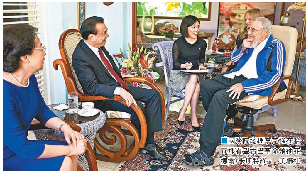
▲國務院總理李克強在哈瓦那看望古巴革命領袖菲德爾·卡斯特羅。

菲德爾·卡斯特羅說，古巴高度重視農業生產，其中蔗糖產業非常發達，糧食生產能夠滿足本國需求，並在越來越多地學習其他國家的先進農業技術，開展更多合作。我們特別注意通過加強年輕人的教育，提高生產水平。希望在農業現代化方面同中方加強交流，實現合作共贏。