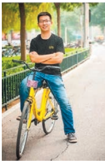
ofo 創辦人兼 CEO 戴威。

ofo 上線至今已近7萬輛共享單車，日訂單超過50萬，為全國20座城市超過150萬師生提供便捷的出行服務，成為了內地規模最大、成長最快的共享單車平台。 滴滴方面表示，中國是全球最複雜多樣、也是最生機勃勃的出行市場，ofo 和滴滴都是「大眾創業、萬眾創新」戰略的受益者和踐行者。作為滴滴未來城市共享出行開放生態建設戰略的一部分，滴滴出行與 ofo 將進一步圍繞「城市出行共享」展開戰略合作，用戶在滴滴平台上亦有望直接體驗到 ofo 的服務。