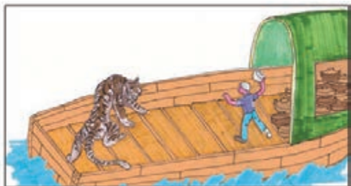
眾人的理解：某人在一條滿載缸瓦煲的船上遇上老虎，情急時便拿煲擲向老虎，看看可會把牠嚇退。

「缸瓦船打老虎——盡地一煲」是一句高頻次使用的廣東歇後語，「破釜沉舟」、「孤注一擲」就是其寓意。