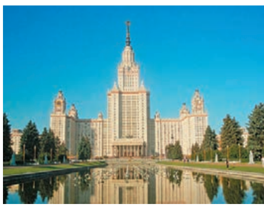
莫斯科大學堅守傳統。

離開抽象的思索，現實中，小說《莫佳阿姨》的翻譯工作已經接近尾聲，其中的伊里亞神父就畢業於謝爾吉耶夫鎮的神學院。