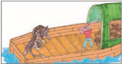
某漫畫家的理解：某人在一條滿載缸瓦煲的船上遇上老虎，為保性命，拿起木棍與虎搏鬥。