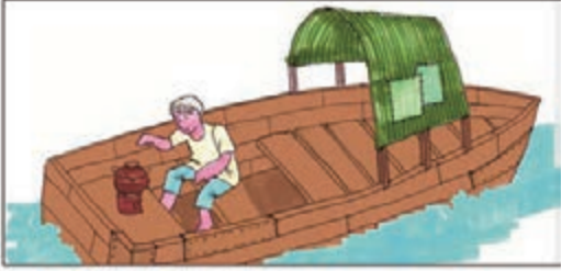
筆者的「狂想」：情況並非如上述，應是在一條簡陋(破)的小船上，由於空間有限，煮食時只得一煲可用。

假如「缸瓦船」解作運送缸瓦的船，又假如在船上真的「遇上老虎」，可以做的，當然是順勢「提起缸瓦煲向老虎擲去」，看看可會把牠嚇退。