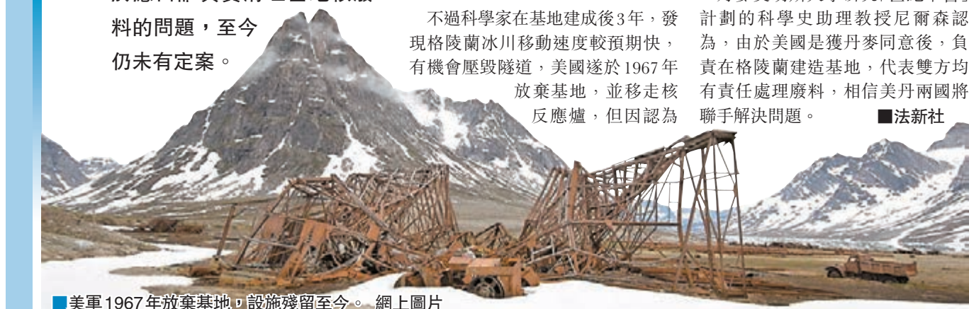
美軍1967年放棄基地，設施殘留至今。網上圖片

丹麥奧胡斯大學研究「世紀軍營」計劃的科學助理教授尼爾森認為，由於美國是獲丹麥同意後，負責在格陵蘭建造基地，代表雙方均有責任處理廢料，相信美丹兩國將聯手解決問題。 ■法新社