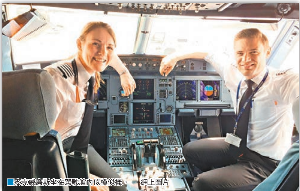
麥克威廉斯坐在駕駛艙內似模似樣。