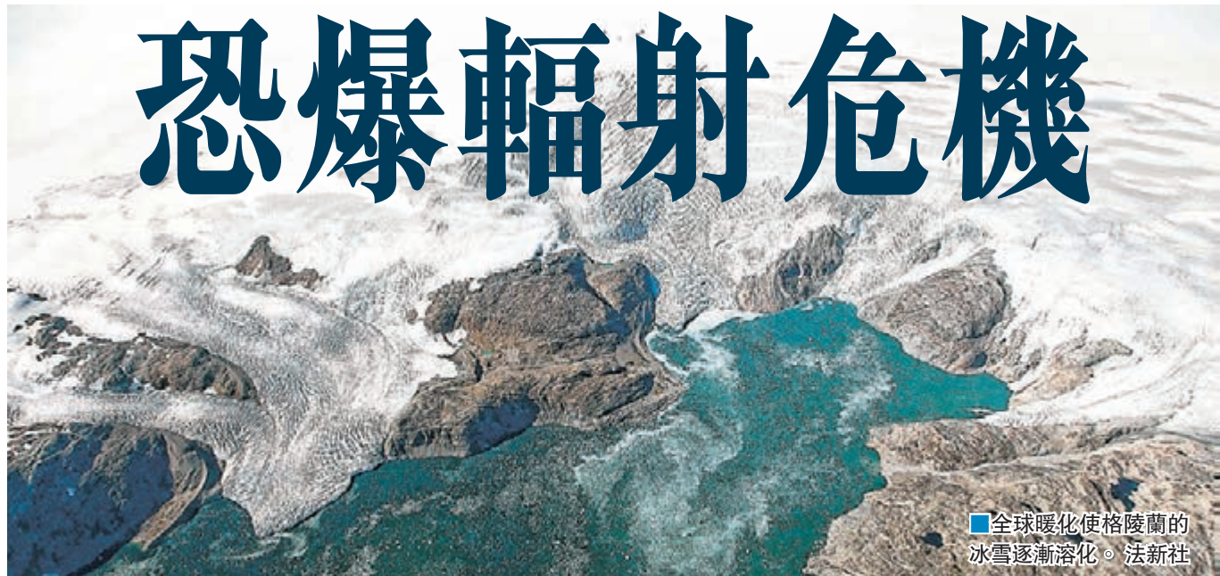
全球暖化使格陵蘭的冰雪逐漸溶化。

全球暖化使格陵蘭的冰雪逐漸溶化，令當地一個遭冰封的冷戰時期美軍基地或重見天日。由於該基地充斥大量含輻射廢料，一旦露出地表，恐令污染物洩漏，引致環境污染甚至生態危機。至於應由誰負責清理基地核廢料的問題，至今仍未有定案。