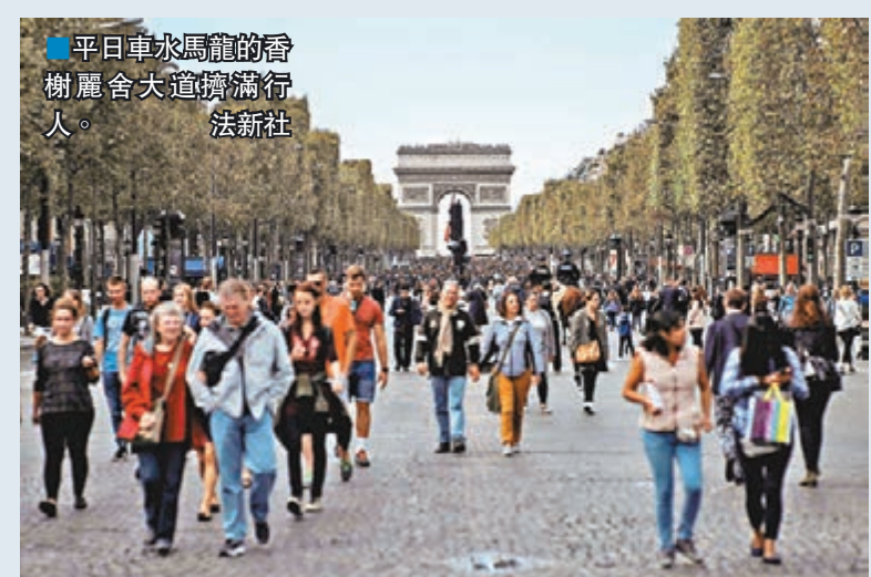
平日車水馬龍的香榭麗舍大道擠滿行人。

法國巴黎前日舉行第二屆「無車日」，佔市內接近一半道路面積、總長度達650公里的路段被列為禁車區，香榭麗舍大道更變身成人專用區。負責檢測大巴黎地區氣候的組織Airparif指，當日巴黎二氧化碳含量減少20%至35%。