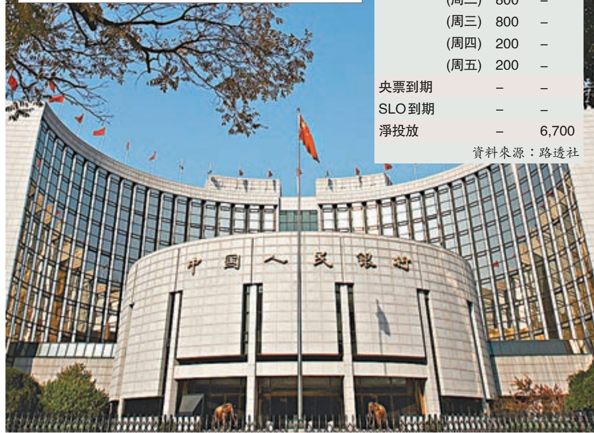
中國人民銀行昨日在公開市場淨投放800億元人民幣。