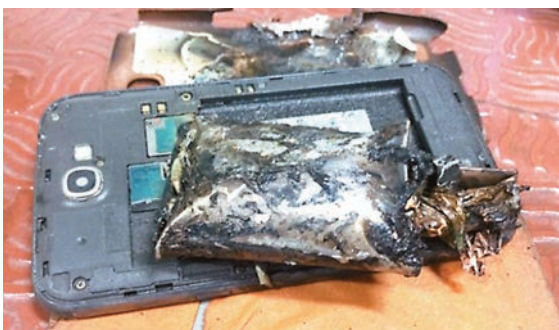
■Note 2手機在行李架冒煙。網上圖片