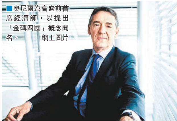
■奧尼爾為高盛前首席經濟師，以提出「金磚四國」概念聞名。