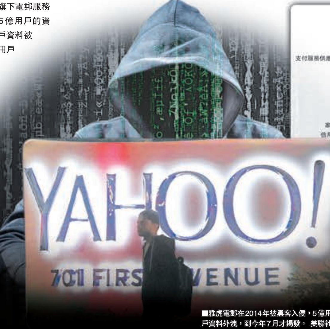
■雅虎近年積弱不振，現時電郵活躍用戶僅1.61億。網上圖片