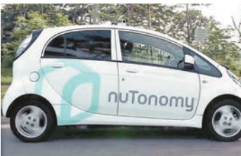
■nuTonomy無人駕駛的士免費試搭，反應踴躍。