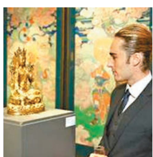
觀眾正欣賞佛教銅像《綠度母》