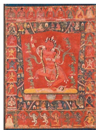
金剛亥母 漢藏，約12世紀

展中亦可見到明嘉靖青花靈芝紋瓶，大瓶由青花釉作飾，瓶身飽滿，敞口內斂，束頸雙肩，圈足微外撇。瓶身頂部以梵文裝飾，梵文在西藏尼泊爾等地常被用於佛教的禱文或特殊的經文。瓶身頂部的中心是由卷葉紋圍繞的佛教「唵」字。瓶身中央的主體是由纏枝紋所裝飾的巨大靈芝。瓶身底部則是兩條三爪飛龍戲珠的圖案。通過大瓶的形狀和圖案，透露出它曾被用作佛教寺廟的祭祀用途。