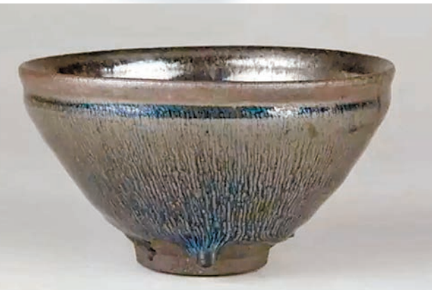
兔毫盞大都會博物館藏