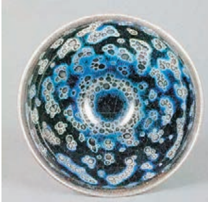
曜變天目盞 靜嘉堂藏

宋代鬥茶藝術傳到日本，經過吸收發展的抹茶道，能夠很好地流傳下來。優美而稀少的建窯長期以來是日本上層階級珍藏的寶物，尤其在十五世紀達到高潮。《君台觀左右帳記》記載，曜變是建窯之無上神品，世上罕見之物，值萬匹絹。油滴是第二重寶，五千匹絹，兔毫盞，三千匹絹。當今，優秀的建窯大都被日本收藏。僅存於世的三件曜變都被日本藏為國寶。油滴傳世品也僅十餘件，其中一件為日本國寶。我國沒有一件完整的油滴。藏於日本靜嘉堂文庫的曜變被國際陶瓷界公認為天下第一名碗並譽為陶瓷藝術的珠峰，但至今無人能複製，這也就可以理解當年為