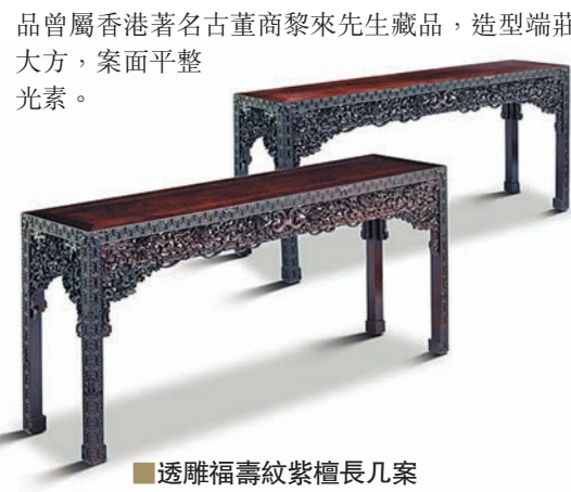
透雕福壽紋紫檀長几案