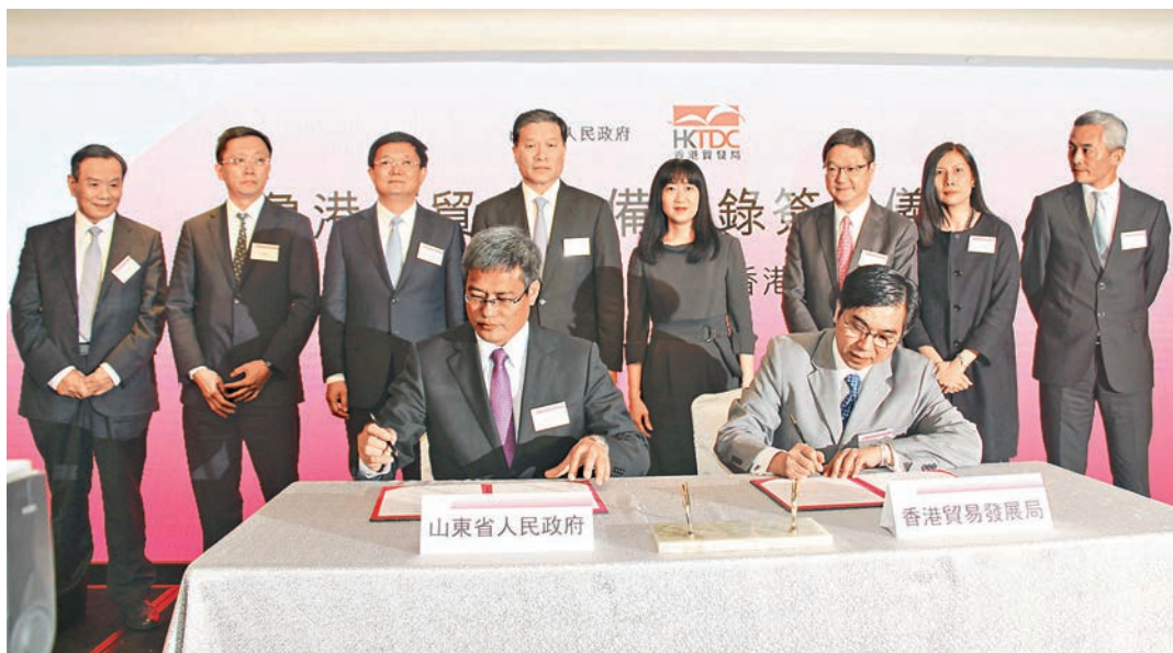
■山東省政府與香港貿發局簽署2016魯港經貿合作備忘錄。

忘錄,雙方將深化魯港兩地合作,共拓「一帶一路」商機,促進企業「走出去」。還將拓展合作新領域,促進魯港創意文化產業交流。