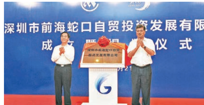
■廣東省委副書記、深圳市委書記馬興瑞(右)和招商局集團董事長李建紅出席儀式並為深圳市前海蛇口自貿投資發展有限公司揭牌。 本報深圳傳真

招商局與前海管理局於今年6月簽署《關於組建合資公司推動前海蛇口自貿區管理體制機制創新的框架協議》,按協議要求,招商蛇口控股子公司深圳市招商前海實業發展有限公司與前海管理局下屬全資子公司深圳