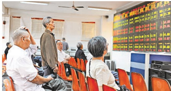
■ 高盛分析報告認為,A股仍有上行空間,目前是佈局的好時機。圖為成都某證券營業部大盤前的股民。

針對MSCI中國指數,高盛由「中性」上調至「增持」,12個月目標價由60.5上調至70,這也意味著該指數仍有約一成的上漲空間。張徑賓解讀,近期中國政府和社會資本合作(PPP)示範項目即將公佈,第四季尚有「深港通」開通、人民幣納入特別提款權(SDR)以及養老金入市等利多待發酵,A股基金中