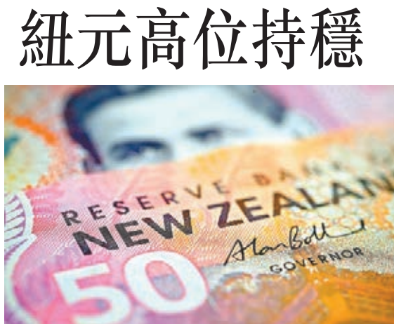
■ 圖為新西蘭貨幣。

加拿大央行總裁波洛茲周二表示,加拿大利率將在更長時間內維持在低位,因經濟面臨強大阻力,且企業投資弱於預期,但政府基礎設施建設支出將提振經濟增長。波洛茲稱,鑒於目前的低息環境,企業需調整對投資回報的預期。波洛茲的講話表明,加拿大央行仍將按兵不動,即便經濟難以獲得動能。波洛茲表示,經濟繼續受到強大不利因素的傷害,需刺激性貨幣政策來加以反制,並朝滿載產能更進一步;但他希望企業和政府都來承擔激勵增長之責。