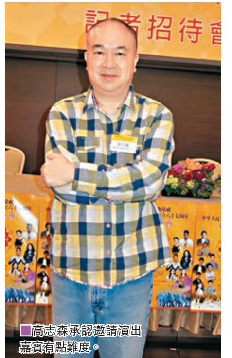
高志森承認邀請演出嘉賓有點難度。