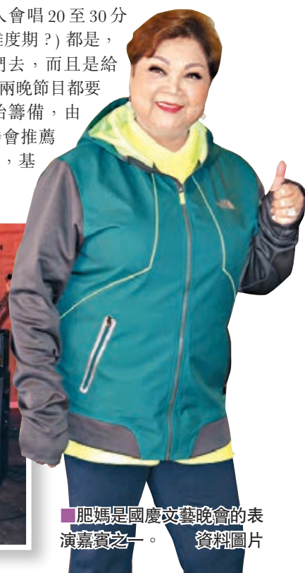
肥媽是國慶文藝晚會的表演嘉賓之一。資料圖片