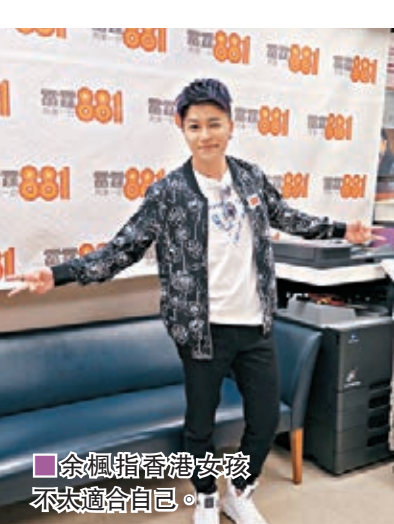
余楓指香港女孩不太適合自己。

提到荷里活影星安祖蓮娜祖莉申請與丈夫畢彼特離婚,並指二人有不能彌補的分歧,更外傳畢彼特有吸大麻、酗酒、情緒問題及外遇,余楓說:「我都大跌眼鏡,印象中畢彼特不會劈腿。雖然大麻很常見,但他是爸爸,發生在他身上也不好。」另外,余楓年底會跟其他歌手在香港會展舉行《中國好歌星》演唱會,他透露屆時會獻唱未發表的新歌。