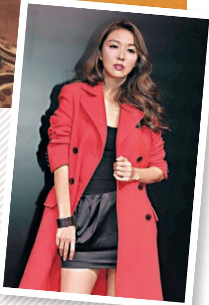
薛凱琪會在10月2日出席青年音樂會。