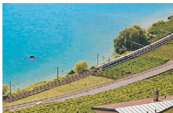
瑞士拉沃夏景 在瑞士西部拉沃拍攝的梯田式葡萄園夏日美景。