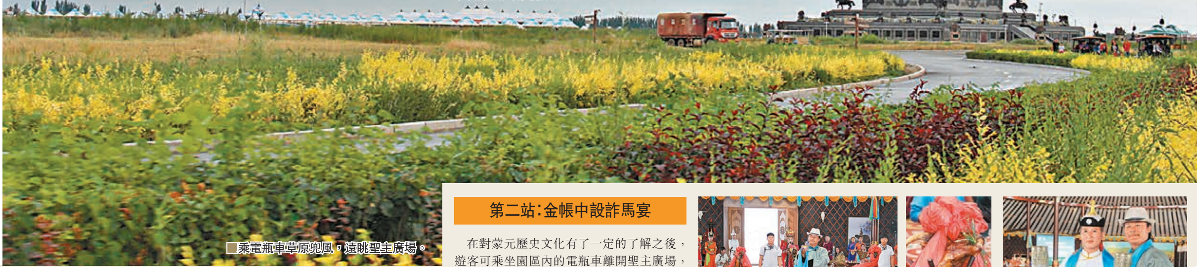
■ 乘電瓶車草原兜風，遠眺聖主廣場。

敕勒川草原文化旅遊區是內蒙古自治區文化旅遊產業「十二五」所打造的重點項目，位於內蒙古自治區首府呼和浩特市土默特左旗的西部，從呼和浩特市驅車前往，60公里的車程僅需40分鐘便可抵達，絕對是一次性感受草原遼闊無邊、大青山層巒疊嶂、濕地清幽怡人、湖泊水趣盎然、溫泉水暖人心脾的好去處。而若是碰巧並非由呼和浩特市出發，敕勒川草原文化旅遊區西距包頭市也不過80公里，雖然與鄂爾多斯市離得稍微遠一些，卻也只有110公里。因此這個被「呼包鄂」三座城市所包圍的草原文化旅遊區所在地，又被當地民眾形象地稱之為「金山角腹地」。