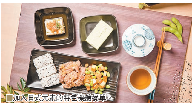
■ 加入日式元素的特色機艙餐單。

而早前推出的 reward-U 獎賞計劃，旅客凡購買機票和增值服務，包括網上訂購機艙餐飲，消費的一分一毫皆可以賺取積分。除了全新機艙餐單外，航空公司同時亦推出震撼機票優惠，單程票價低至港幣88元。優惠推廣期已於9月20日開始，今天（9月22日）晚上23時59分結束，優惠適用於大部分航線，出遊有效日期由今年10月4日至明年7月13日，如想買平機票，就趁今天最後一天，進入 www.hkexpress.com 試一試。