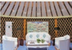
■ 舒適的現代化蒙古包。