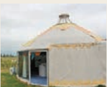
■ 坐在蒙古包內就能欣賞草原美景。