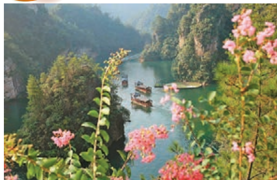
張家界秋韻 遊客在湖南張家界寶峰湖風景區乘船遊覽。