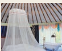
■ 設施齊全的現代化蒙古包。