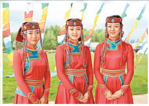
■ 爽朗活潑的蒙古族少女。