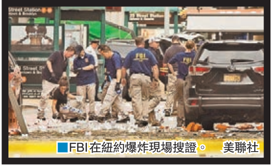
FBI在紐約爆炸現場搜證。

紐約爆炸案疑犯於2014年曾持刀襲擊家人，被父親告發為「恐怖分子」，雖然他因此入獄3個月，但聯邦調查局(FBI)當年卻以無證據顯示拉哈米與恐怖主義有聯繫為由，未有起訴他。今次事件令外界擔心，當局在個別人士與恐怖組織沒有已知聯繫的情況下，應如何阻止他們施襲。