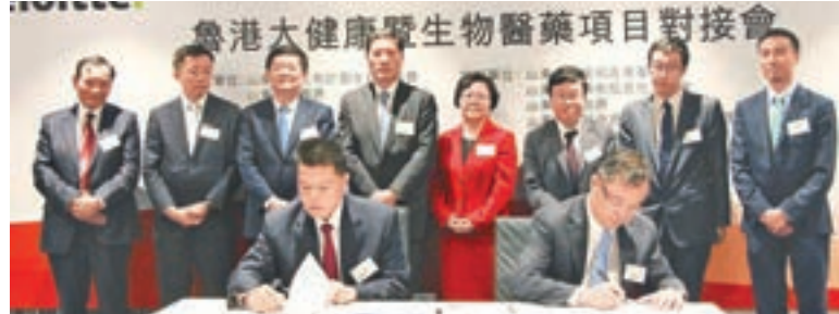
魯港大健康醫藥項目對接會簽約儀式。

香港文匯報訊(記者 丁春麗、楊奕露 報導)魯港大健康醫藥項目對接會昨在港舉行,現場簽約多個大健康項目。其中,華潤醫藥與濟南臨淄區人民醫院、桓台縣人民醫院、張店區婦幼保健院合