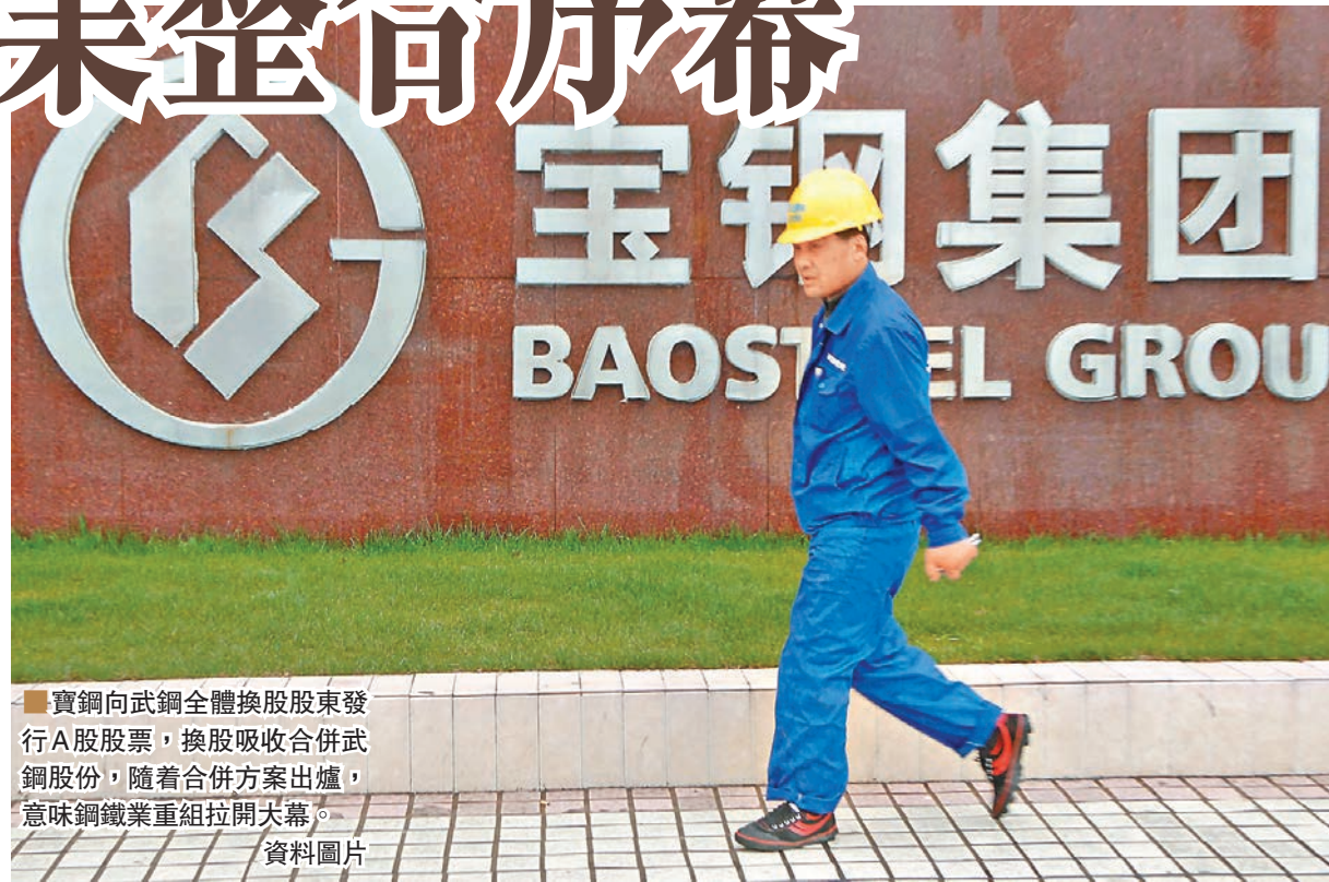
寶鋼向武鋼全體換股股東發行A股股票,換股吸收合併武鋼股份,隨着合併方案出爐,意味鋼鐵業重組拉開大幕。

興業證券認為,隨著「深港通」等重大事件落地,內地資金出現了明顯南下趨勢,港股呈現「窪地效應」,分流了A股的部分資金,而A股本身亦缺乏持續熱點,無法形成明顯的賺錢效應,使得市場的內生性上漲動力不足,在這樣的行情中,投資者應降低收益預期,合理安排倉位水平,避免盲目追高。