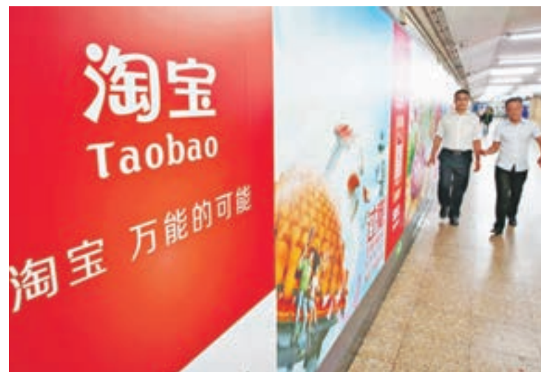
淘寶以2,300億元的品牌價值超過騰訊,首次成為「最具價值中國品牌」。

今年不少上揚品牌中包括安踏、格力、光明、蒙牛等都贊助了今年的里約奧運會,胡潤表示上揚品牌對娛樂,特別是體育的興趣超熱,包括很多中國企業家都在收購海外足球隊,這些都是中國品牌成熟度提升的表現。