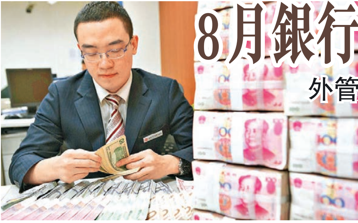
國家外匯管理局數據顯示，8月銀行結售匯逆差收窄至95億美元，創2015年7月以來新低。