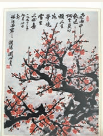
■關山月作品展將首次在十香園展出