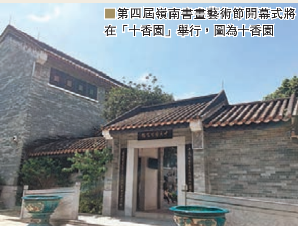
■第四屆嶺南書畫藝術節開幕式將在「十香園」舉行，圖為十香園

研究生教學實踐基地掛牌儀式。學院將每年組織研究生到十香園紀念館參觀、學習，與嶺南畫派名家一起交流，共同推動嶺南書畫藝術創新發展。