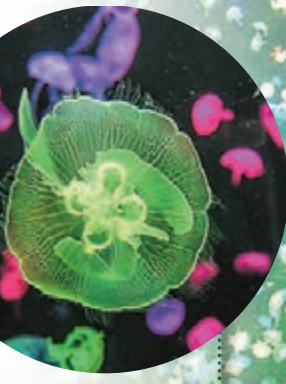
■ 水母配合燈光控制系統，可演繹全球罕見的水母「燈光舞」。