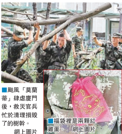
■ 颱風「莫蘭蒂」肆虐廈門後，救災官兵忙於清理損毀了的樹幹。