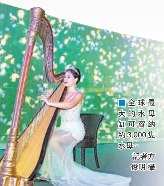
■ 全球最大的水母缸可容納約3,000隻水母。