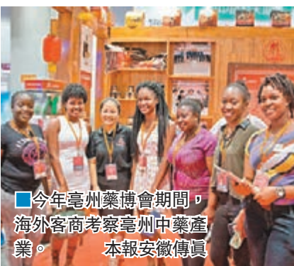
■ 今年亳州藥博會期間，海外客商考察亳州中藥產業。

今年1月至7月，亳州市中藥材在地種植面積達91.1萬畝，同比增長4.5%；全市實現規模以上醫藥製造業產值140.88億元，同比增長16.14%。目前，亳州市擁有藥業生產企業151家，其中通過良好生產規範(GMP)認證的藥品生產企業139家。同時，該市已形成內地最大的中藥製劑產業集群，製劑加工企業達到137家。