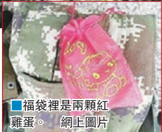
■ 福袋裡是兩顆紅雞蛋。