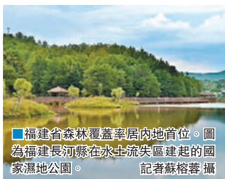
■ 福建省森林覆蓋率居內地首位。圖為福建長河縣在水土流失區建起的國家濕地公園。

香港文匯報訊(記者 蘇榕蓉 福州報導)福建省森林覆蓋率連續多年居內地首位。福建省林業廳近日發佈的數據顯示，福建省年森林生態服務價值為8,014.01億元(人民幣，下同)，具有極高的生態效益和經濟效益。