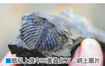
■ 酷似上億年三葉蟲化石。

重慶市酉陽土家族苗族自治縣毛壩鄉毛壩村前日發現一奇特東西，看起來像是什麼昆蟲化石，幾位當地村民在現場看了這一從未見到過的化石。與平時在電視上看到的化石一模一樣，長約70厘米，寬約3厘米的不明古生物輪廓清晰可見。化石雖有受損，但不影響其科研價值，從化石尾部受損的剖面看，該化石應該是軟體動物，是古脊椎動物、脊索動物的