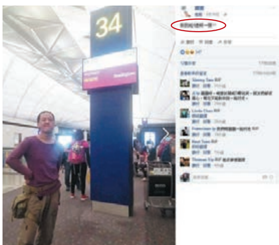
冰島車禍死者出發前在機場拍照，並戲稱「到我啦，遺照一張」（紅圈示）。

許，與友人在Só lheimsandur beach將兩部汽車停在公路路肩位置下車，其間蔡被另一名外籍遊客駕車撞倒重傷，送院不治。不少網友得悉「圓圈」的噩耗後，紛在其fb上留