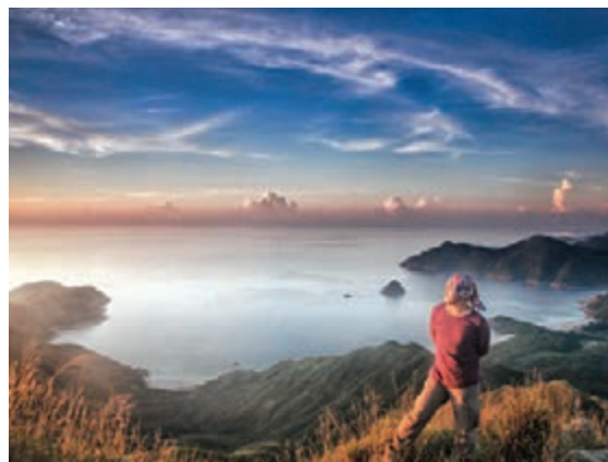
冰島車禍死者面書照片。

許，與友人在Só lheimsandur beach將兩部汽車停在公路路肩位置下車，其間蔡被另一名外籍遊客駕車撞倒重傷，送院不治。不少網友得悉「圓圈」的噩耗後，紛在其fb上留