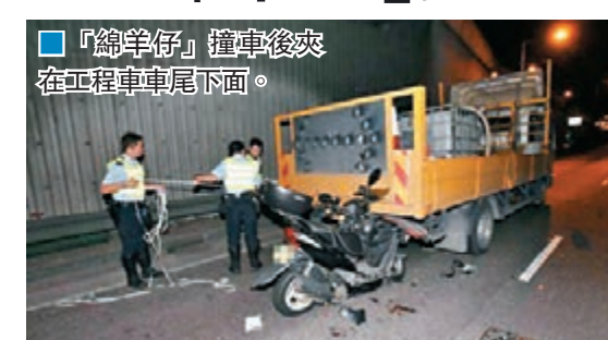
「綿羊仔」撞車後夾在工程車車尾下面。

香港文匯報訊（記者杜法祖）旺角連翔道近海輝道迴旋處昨凌晨發生嚴重交通意外，一輛「綿羊仔」電單車疑收掣不及，猛撼一輛設有箭嘴鐵號的工程車車尾，身穿旅遊巴公司制服的鐵騎士頭、頸及手腳重創，送院命危，警方正調查意外原因。