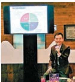
■負責人介紹天貓國際tmall.hk在香港的各種優惠

為滿足香港消費者環球買好貨的需求，天貓國際平台為香港消費者帶來海外原裝進口的特色貨品，在香港零售市場較少見的食品、日用美容及家居商品，如台灣糖村手工法式牛軋糖、泰國Nittaya原裝天然乳膠頸椎按摩枕、美國NEATO