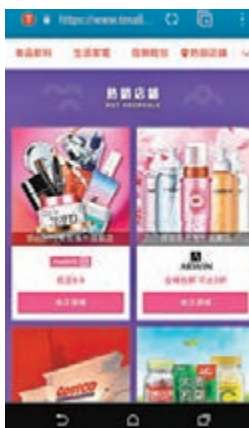
■不少商品由海外品牌原裝進口到港。