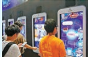
■《遊戲王》新的手機遊戲，可在超大屏幕試玩。