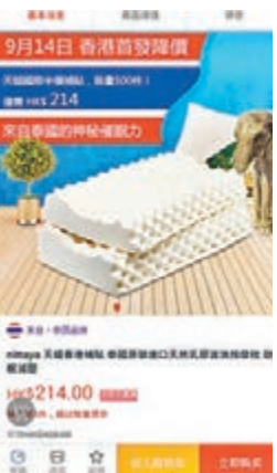
■這個泰國原裝天然乳膠頸椎按摩枕是Nittaya海外旗艦店的商品。