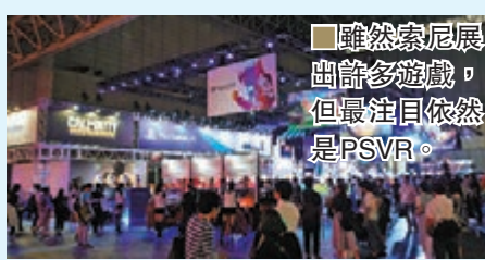
■雖然索尼展出了許多遊戲，但最注目依然是PSVR。