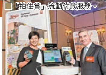
■「拍住賞」流動付款服務。

早前，特區政府宣佈所有流動付款服務需要申請牌照，而HKT Payment Limited就成為香港首批「儲值支付工具」持牌人之一，立即為其Tap & Go「拍住賞」流動付款服務推出一系列新增功能，以供全港手機用戶享用。