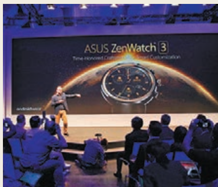
■於德國的柏林舉行的IFA 2016 Zenvolution記者會現場。

早前，華碩由全球副總裁陳彥政率領團隊於德國柏林舉行IFA 2016 Zenvolution記者會，發表了品牌首款圓形智慧型手錶ZenWatch 3，其靈感源自於日環蝕時刻和日冕所散發出的環形光芒，採用秉持優良傳統製錶工藝精製的珠寶級316L冷鍛鋼，並設三顆獨立的錶冠設計快速存取功能。而且，它內置50種以上的風格錶面及自訂顯示資訊程式，讓佩戴者輕鬆創造個人獨特風格。