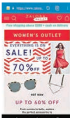
■網站會定時推出Outlet，供網友以較優惠價錢購買心頭好。