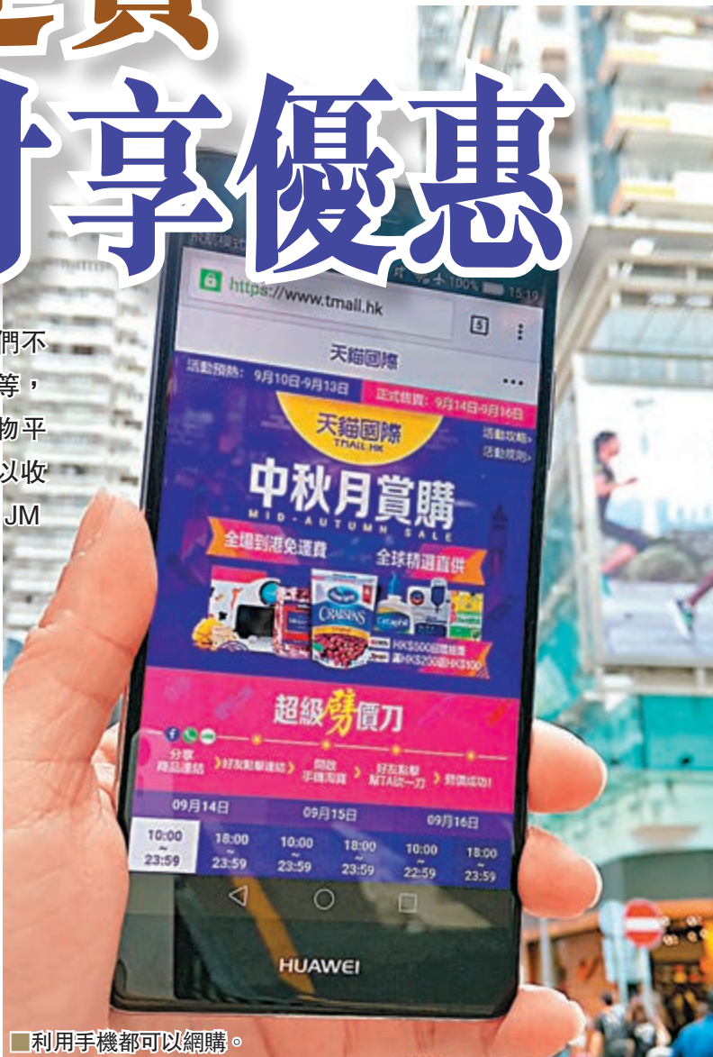
■利用手機都可以網購。