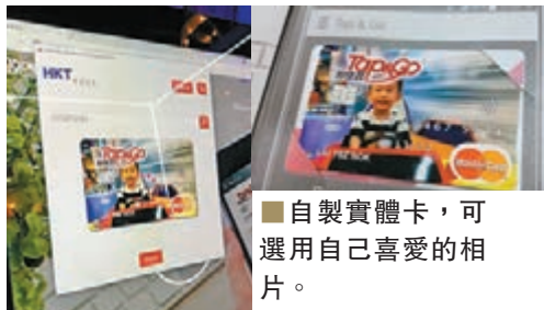
■自製實體卡，可選用自己喜愛的相片。

最近，更特設了一個新功能，就是Selfie-A-Card，可讓大眾設計「拍住賞」卡面並將其個性化。而客戶亦可選用預先設計好的卡面。同時，「拍住賞」將推出獨家限量版的「拍住賞電動方程式」卡，將成為「香港電訊電動方程式」國際賽車盛事的官方流動手機付款服務供應商。