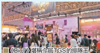
■《Bio7》堪稱今屆TGS的排隊王。

對年輕族群。試玩版畫面流暢，可試到簡單的「剪刀、石頭、布」式屬性相剋互鬥，且還可拾取巨蛋孕育成新的怪物同伴，有著相當高育成要素。