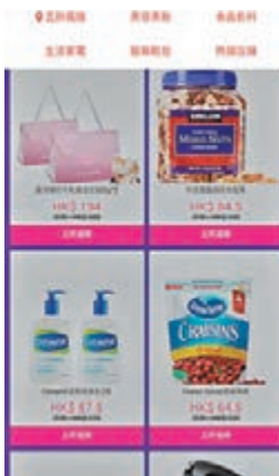
■網站設有五折瘋搶、美容美妝、食品飲料、生活家電、服飾鞋包、熱銷店舖以供選擇。