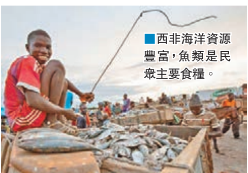
西非海洋資源豐富，魚類是民眾主要食糧。