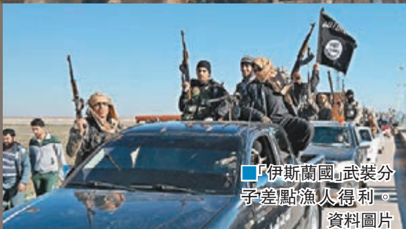
「伊斯蘭國」武裝分子差一點佔領重地。資料圖片

美國戰機轟炸敘利亞政府軍，不但造成人命傷亡，更令政府軍對「伊斯蘭國」(ISIS)的戰事受挫，一度失去戰略重地。