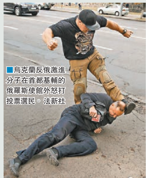
烏克蘭反俄激進分子在首都基輔的俄羅斯使館外怒打投票選民。