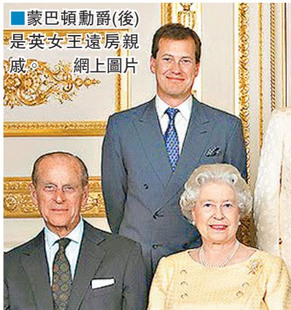
蒙巴頓勳爵(後)是英女王遠房親戚。