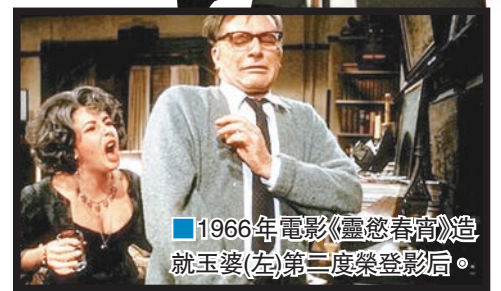
■1966年電影《靈慾春宵》造就玉婆(左)第二度榮登影后。

等。阿爾比2005年獲頒東尼獎終身成就獎。阿爾比晚年健康轉差，飽受糖尿病之苦，數年前進行大手術前寫下一紙短箋，打算在逝世後公開：「給予那些令我生命如此美妙、刺激及充實的人們，我的感謝及所有的愛。」阿爾比助手透露他在逝世前「非孤獨一人」。阿爾比的作品以黑色幽默、大膽舞台作風及辛辣台詞見稱，對美國人生活及價值觀作批判及反思。別樹一格的作風贏盡口碑，卻令他失落不少獎項，《靈慾春宵》在1963年曾獲普立茲獎評審委員會提名戲劇獎得主，但董事會認為題材太具爭議而否決。 ■美聯社