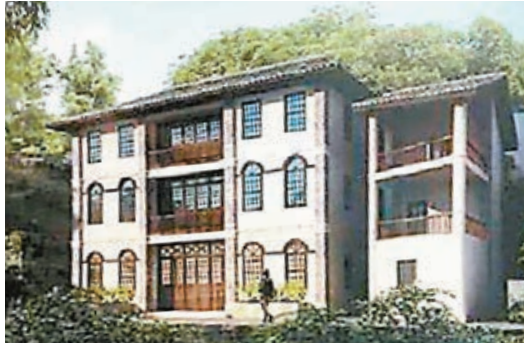
■天官府郭沫若辦公地效果圖。 本報重慶傳真