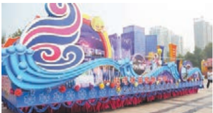
■準備出發的花車。

2016洛陽河洛文化旅游節於昨日上午在河南洛陽開幕。洛陽市市長劉宛康在開幕式上表示，今年的河洛文化旅游節，緊緊圍繞「暢遊河洛靈動山水、領略千年帝都風情」主題，包括開幕花車巡遊、河洛文化研討會等6項主題活動及11項專項活動，節會內容豐富，突出以節惠民，向中外遊客全景展示一個美麗祥和的洛陽、一個開放包容的洛陽、一個活力迸發的洛陽。