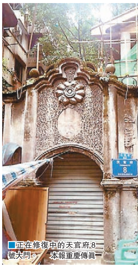
■正在修復中的天官府8號大門。

「這份由312人聯署的《進言》，最先發表於1945年2月22日重慶《新華日報》。」文管所相關負責人表示，由於《進言》與國民黨針鋒相對，引起了國內外輿論界極大震動，蔣介石對此惱羞成怒，於1945年4月1日解散了文化工作委員會。