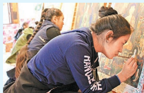
■ 藏族姑娘繪唐卡。