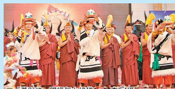
■ 「黃財神」賜福氣九奶袋。

福氣九奶袋是福祿袋的一種，製作十分考究。首先，將純白棉布裁成大小一樣的9塊，再進行縫製，象徵佛教的九乘之道；接着，用三色絲綢布條圍裹成大袋，並裝滿金銀、寶石、五穀等招財聖物，要求縫製過程保持潔淨；然後，用沒有黑色的五彩帶進行捆紮，並由高僧大德進行誦經加持法力，象徵五