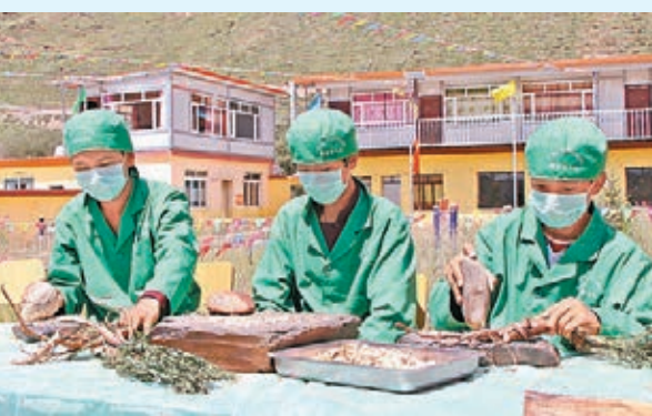
■ 藏族小伙砸樹根製作藏紙。

康瑪廟、經堂四部分組成，是覺囊派三大寺的主寺。寺內矗立一尊13米高的彌勒佛銅像，形態高大、體態莊重、面目慈祥。金碧輝煌的康薩佛殿收藏有古代鑲金佛、文成公主親手刺繡的《藥王佛》唐卡等稀世之寶；氣勢宏偉的寢宮供奉有大小不等的佛像4,000餘尊，400平方米的彌勒佛唐卡被譽為藏區唐卡之冠。「這部大藏經保存完好，距今已有1,000多年。」確爾基寺住持展示了一件鎮寺之寶，稱該寺藏有佛經一萬多卷。