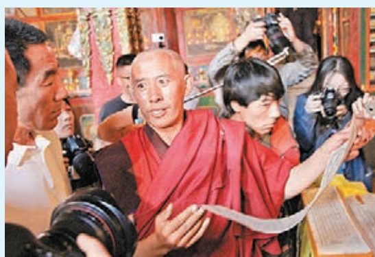
■ 確爾基寺住持展示千年大藏經。