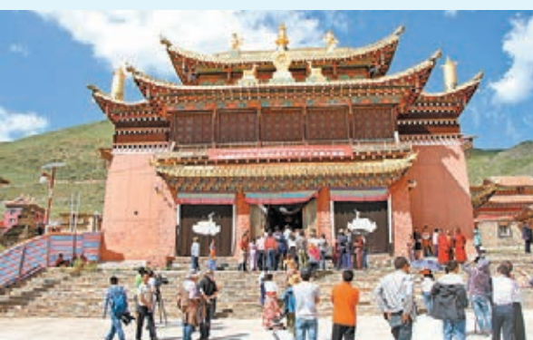
■ 雄偉壯觀的確爾基寺。