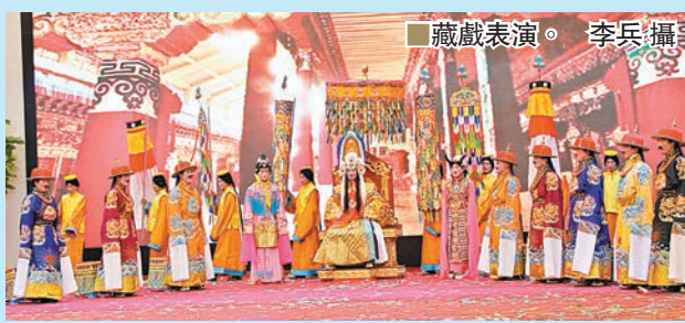
■ 藏戲表演。

整個舞台上有一金剛唱誦師、法號師、噴噴師等20餘人，分為恭迎、沐浴、皈依、禮讚等幾個部分。整個演出，沒有大的起伏，但聲音清淨、空靈，特別有穿透力。坐在台下，雖看不懂台上的表演，聽不懂吟唱什麼，但內心卻分明受到深深的感染。「這些樂僧，經過了10年以上的唱誦練習和