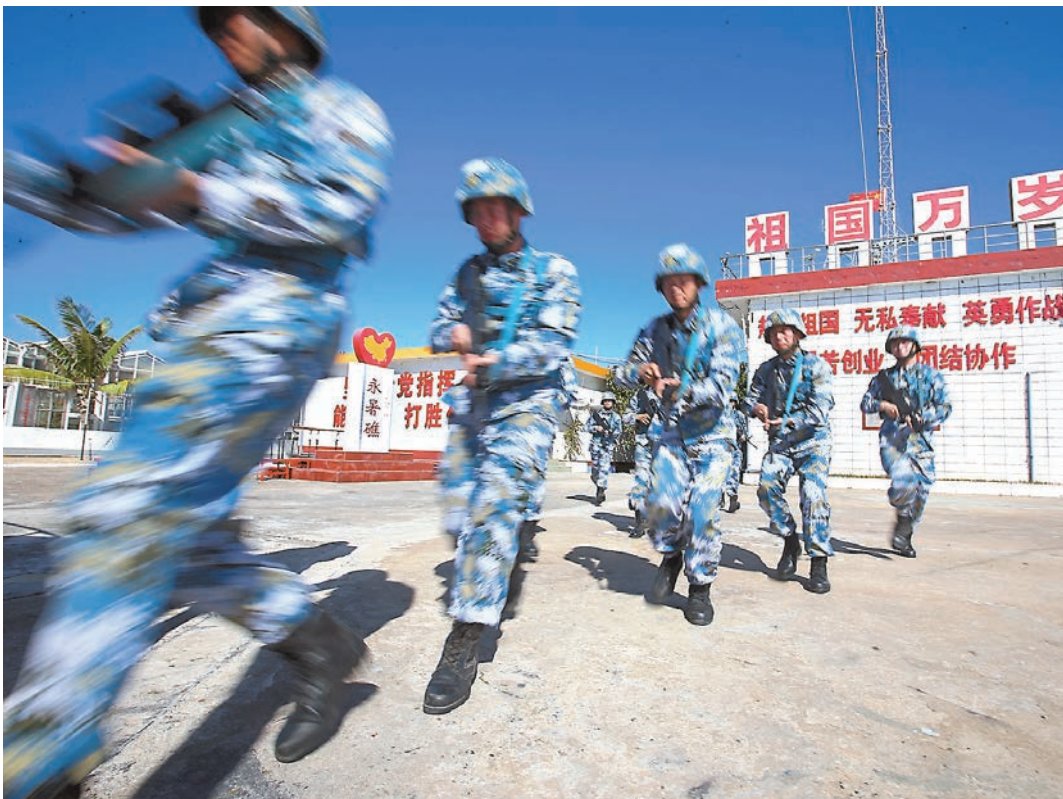
■日方計劃與美軍在南海有爭議水域進行聯合巡航，可能已經觸及中國的底線。圖為守衛在南沙群島永暑礁上的海軍官兵在進行軍事訓練。

香港文匯報訊（記者 江鑫嫻 北京報道）美國當地時間9月15日，日本新任防衛大臣稻田朋美在美國華盛頓發表演講時稱，日方計劃與美軍在爭議水域進行聯合巡航以及舉行雙邊和多邊軍演，以此升級在南海的行動。有分析認為，稻田朋美的講法很可能已經觸及中國的底線。對此，中國社科院日本所外交研究室主任呂耀東向本報表示，日方主動提出美日聯合巡航南海一事，並不斷製造中國威脅論，只會使南海問題的和平解決進一步複雜化、令地區的安全環境更加惡劣。