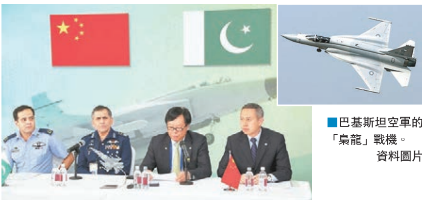
■中航技進出口有限責任公司與巴基斯坦方面舉行聯合發佈會，推介「梟龍」戰機。

此前，「梟龍」戰機已多次參加珠海、迪拜、巴黎、范堡羅等國際航展，其出色的飛行性能贏得了業界的廣泛關注和讚譽。