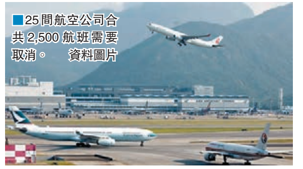
25間航空公司合共2,500航班需要取消。資料圖片

香港文匯報訊(記者 文森)民航處新航空交通管理系統即將全面啓用,下月底起首4個星期的過渡期內,25間航空公司合共2,500班航班需要取消,即每日約減少90班,佔全日總升降時刻約8%。民航處表示,東京、首爾、台北和曼谷等港人旅遊熱點屆時將維持每天不少於40航班。調整措施於11月底前即完結,不會影響聖誕及新年旅遊旺季。