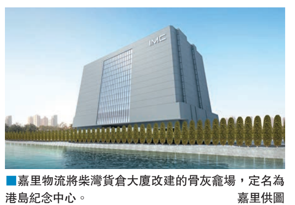
嘉里物流將柴灣貨倉大廈改建的骨灰龕場,定名為港島紀念中心。

疑由「熱普城」支持者成立的fb專頁「仇幼聯」也發帖道:「呀大學生,而(噏)家講緊你強調自己係『港大人』,唔好拎後半句出黎(噏)混淆視聽囉。」「港大幫」似乎不甘示弱,成立「敬幼聯」fb專頁,更發帖揶揄道:「從前,有一個人(龍門達)走去同個後生仔(馮敬恩)食飯。席間叫個後生仔參與佢個大計。因為後生仔無應承,仲食過餐飯,又知道左(噏)個大計。就係咁,就俾人話係反骨仔。」這場網絡大戰,恐怕玩到2047年都未必玩得完,大家擔定發仔慢慢睇戲啦! ■羅旦