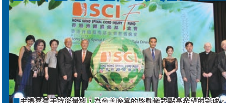
主禮嘉賓手持金槌,為慈善晚宴的啟禮儀式點亮希望的彩球。

為支持和推動脊髓損傷的研究和臨床試驗,幫助全球超過300萬脊髓損傷患者尋求有效治療方法並恢復身體正常功能,香港脊髓損傷基金會(下稱:基金會)慈善晚宴於9月11日在香港君悅酒店隆重舉行。特區行政長官梁振英,警管局主席梁智仁,食物及衛生局局長高永文,香港大學首席副校長譚廣亨,狄恒神父以及基金會籌款委員會委員主席潘黃美玲、董事李婉冰等蒞臨主禮,並為慈善晚宴的啟禮點亮彩球。內地脊髓損傷病友亦登台表演,並分享自己的感受,給晚會增添感人瞬間。