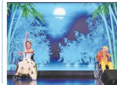
來自昆明同仁醫院的兩位患者在基金會的治療過程中相遇相知相愛,他們於晚宴上表演傣族舞獻給所有幫助過他們的人。

高永文表示自己也曾當過骨科醫生,照顧過脊髓受傷的病人,因此理解患者的苦楚,他支持基金會的工