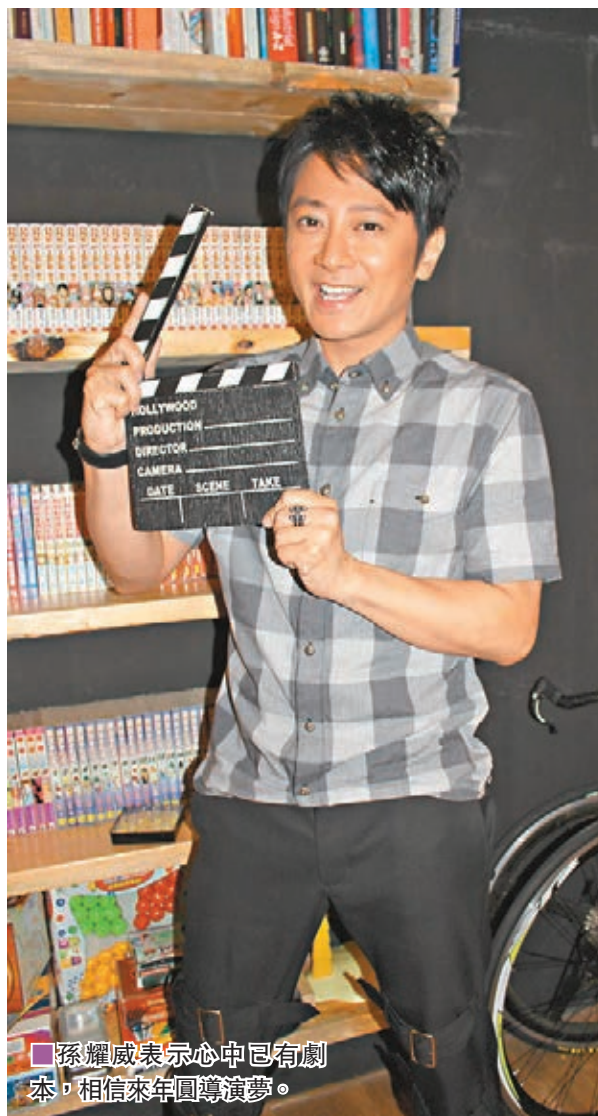
孫耀威表示心中已有劇本，相信來年圓導演夢。