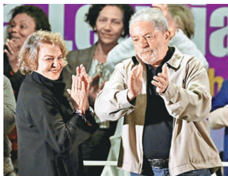
巴西檢察官表示，盧拉是貪案首腦。圖為盧拉與妻子上月出席活動。