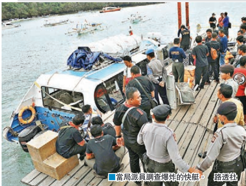
當局派員調查爆炸的快艇。