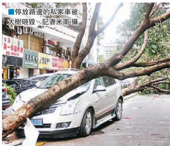
停放路邊的私家車被大樹砸毀。