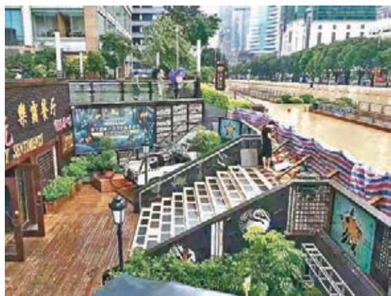
筷子豪情餐廳因成功攔截洪水，被福州市民稱為「民間抗洪標」。

超強颱風「莫蘭蒂」橫掃廈門，重創福建。福州經歷一夜暴雨，清晨推門已水淹半城，福州變「湖州」。據福州氣象部門統計，雨量超過100毫米的有39個鄉鎮。中秋節氣氛被「莫蘭蒂」吹散，交通受阻甚至癱瘓，四十多條巴士線路停運，市民出行困難，有市民划皮筏舟上街。福州每逢大雨必淹的主幹道五四北路一家餐廳，因處地下一層，曾遭遇洪水沒頂之災，今次卻成功攔截洪水，被福州市民爭相稱為「抗洪標杆」，走紅網絡。