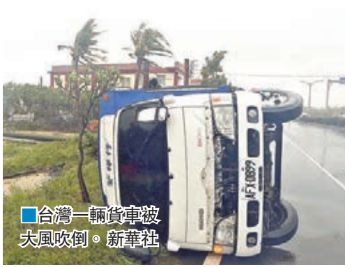
台灣一輛貨車被大風吹倒。

香港文匯報訊 據中社報道，「莫蘭蒂」逐漸遠離台灣，但另一颱風「馬勒卡」卻緊追在後，預計17日最接近台灣。