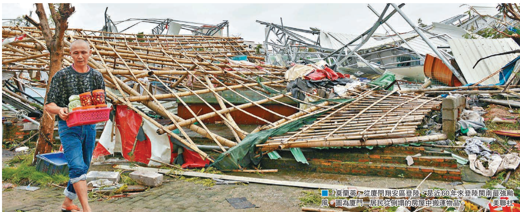
「莫蘭蒂」從廈門翔安區登陸，是近60年來登陸閩南最強颱風。圖為廈門一居民從倒塌的房屋中搬運物品。

截至昨日晚間22時，當地共轉移46,327人，因災死亡1人，直接經濟損失正在統計。另有消息稱，從昨日零時至五時三十分，廈門市120共接警551次、出警93人；全市各醫院共收治病369人，住院57人，手術15台，1人入住ICU。接診病患以玻璃割傷為主，其次為摔傷和孕產婦。