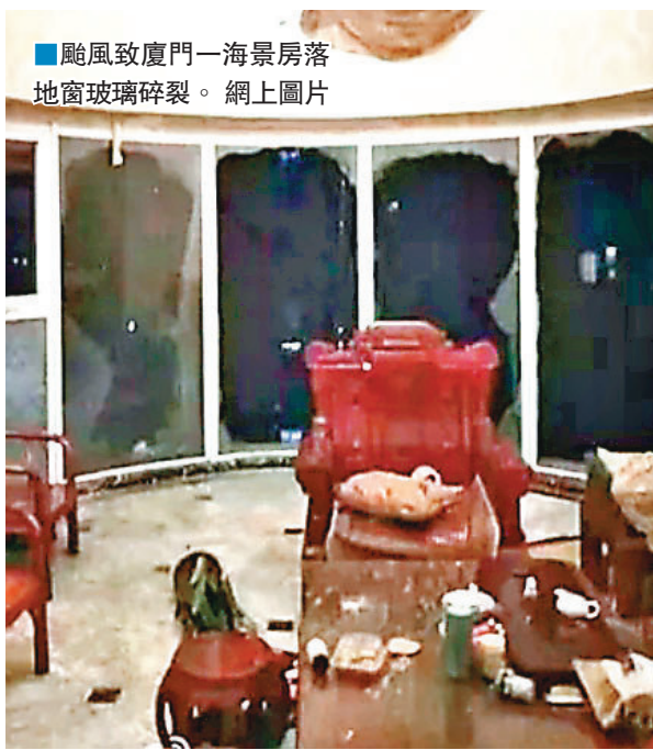
颱風致廈門一海景房落地窗玻璃碎裂。網上圖片