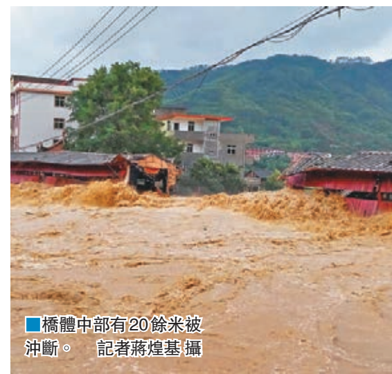
橋體中部有20餘米被沖斷。

記者在泉州中心市區看到，有眾多樹木倒伏，廣告牌等亦被大風吹落，泉州動車站前停車場水淹嚴重。記者發稿前，中心市區內湧嚴重，加上當天中午12時潮位高，受海水頂托影響，湧水外排困難。據泉州市交警支隊消息，昨日上午6時起，由於泉州中心市區大部分路段積水，已對進城車輛採取封閉管制措施，外圍要進入泉州市區車輛都不能通行。