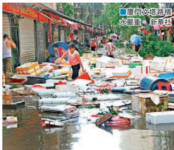
廈門文塔路積水嚴重。